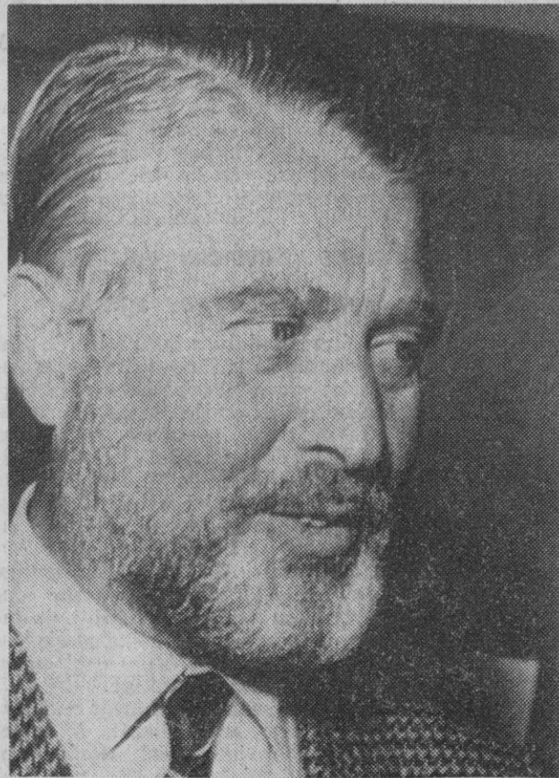
Centro espacial de Houston.—A la izquierda, Werhner Von Braun, que ha sido relegado por la NASA a un cargo puramente administrativo. A la derecha, Frank Borman, comandante del "Apolo 8", que ha presentado su dimisión como piloto y astronauta para pasar a ser vicepresidente de una compañía de computadoras de Dallas.