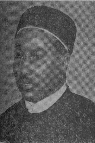
Hassan Ridáha, príncipe heredero de Libia, sobrino del rey Idris, que ha jugado un papel importante en el reciente golpe de estado en su país.

Madrid, 11.—Por el Ministerio de Información y Turismo, ha sido abierto expediente para determinar las responsabilidades que pudieran corresponder al sello fonográfico «Fontana» y a la empresa «Fonogram S. A.» por incumplimiento de las disposiciones vigentes en materia de publicación y distribución de discos en España, con motivo de la distribución y venta en nuestro país del disco «Je t'aime, moi non plus». Al propio tiempo se ha prohibido su difusión y ordenado la retirada de todos los ejemplares que puedan hallarse a la venta de este disco de contenido pornográfico.—Cifra.