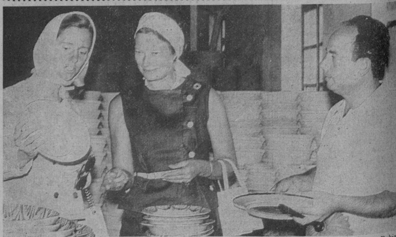
Granada.—Durante su estancia en la ciudad, acompañada por la gran duquesa de Luxemburgo, la reina Fabiola de Bélgica ha visitado la fábrica de cerámica «San Isidro», donde fueron obsequiadas con sendos regalos y recorrieron las instalaciones de este centro, deteniéndose a contemplar algunas de las fases artesanas.

CONDUCTOR: Aproximadamente el quince por ciento de los accidentes de tráfico en carretera, se producen por no circular por la derecha.