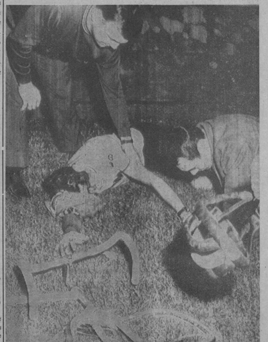
Blois (Francia).—El campeón ciclista belga Eddy Merckx, es recogido sin conocimiento, cerca de su máquina, tras el accidente sufrido cuando se entrenaba con Fernand Wambst en Blois. Wambst resultó muerto en el accidente.—(Telefoto AP-Europa Press).

El Ministerio añadió que otras 476 personas habían sido afectadas por el cólera, pero 141 de ellas ya se habían recuperado.—Efe-Reuters.