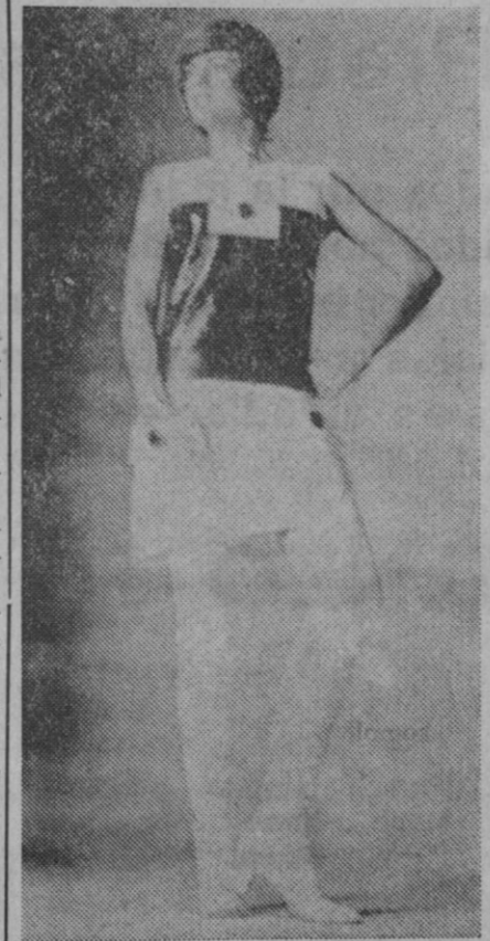
Para el próximo otoño-invierno Jean Hergey presenta este conjunto dos piezas realizado en algodón plastificado blanco y negro. La falda lleva dos grandes bolsillos aplicados. En el blusón, pieza plastrón blanca sobre fondo negro.

El largo: Para calle: el largo se mantiene a 12 cm. encima de las rodillas.