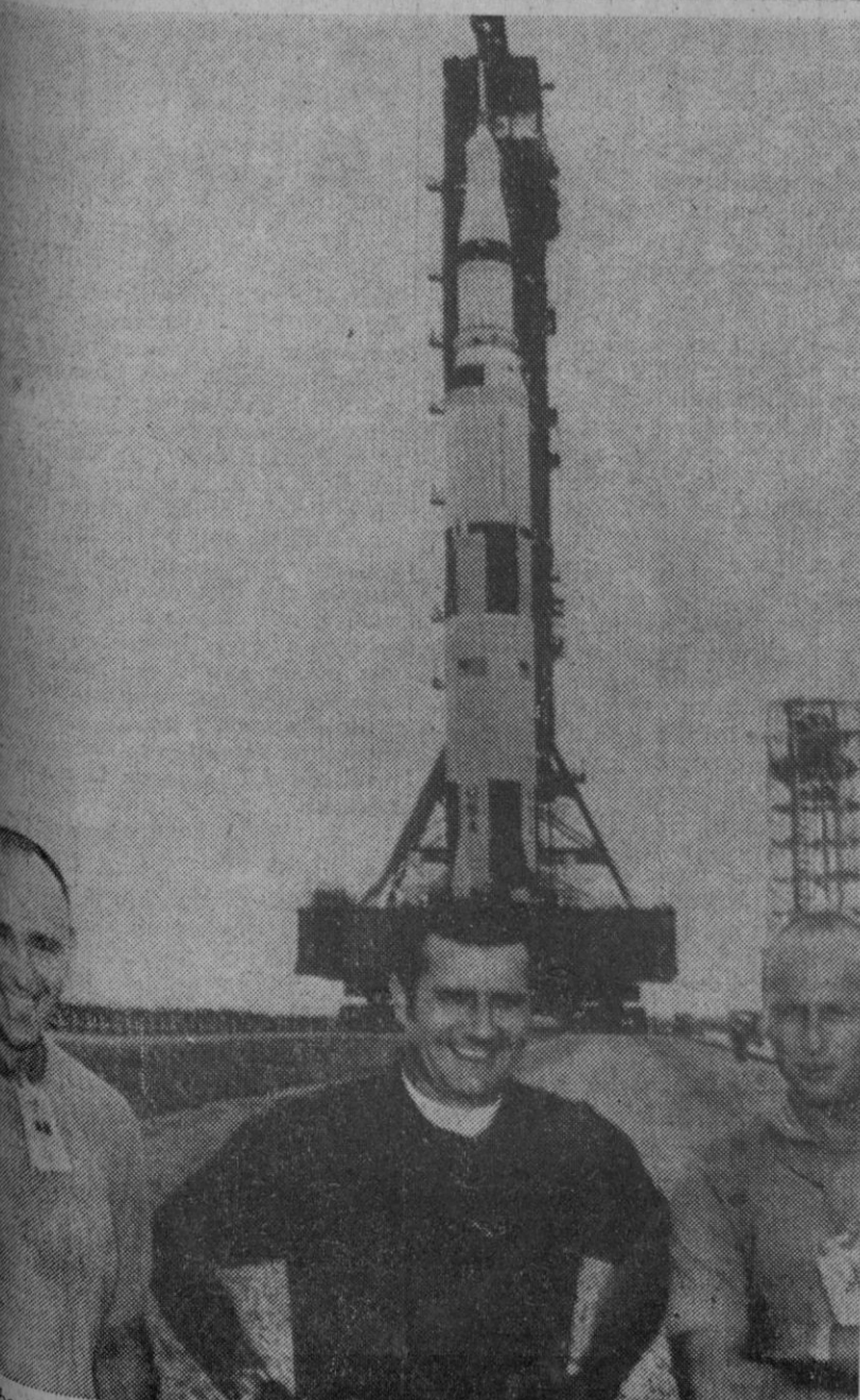
Los tripulantes de la nave «Apolo 12», que aparece al fondo en la rampa de lanzamiento del cohete de treinta y nueve de Cabo Kennedy. Ellos son: Alan Bean, Richard Gordon y Charles Conrad.

Santander, 9.—La primera semana de Castilla y León quedó inaugurada con tres exposiciones de fotografía, artesanía y modelismo naval, a cuyos actos asistieron las primeras autoridades provinciales santanderinas, así como las de las provincias de Castilla y León.