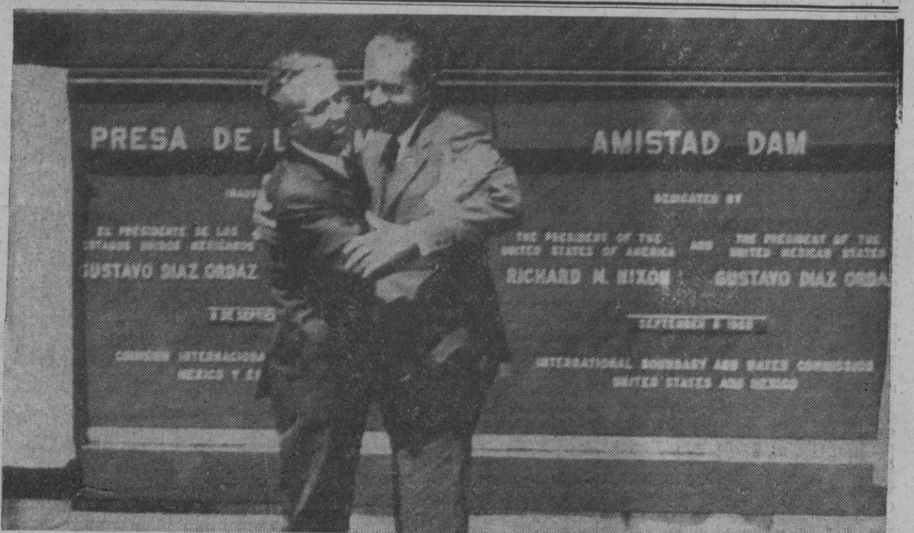
Del Río (Texas).—El presidente Richard Nixon abraza al presidente mejicano Gustavo Díaz Ordaz en la pasarela de la Presa de la Amistad, construida en Del Río, sobre el río Grande. Ambos presidentes asistieron a la inauguración de la presa.—(Telefoto AP-Europa Press)

Índice general de la sesión: 124,88 contra 142,36.—Cifra.