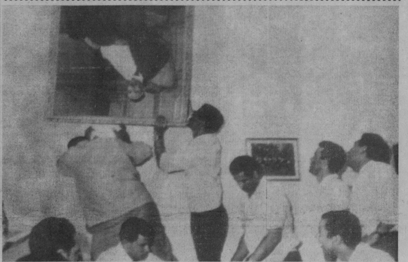
Damasco.—Los estudiantes libios de esta ciudad quitan el cuadro de su exrey Idris I, en uno de los despachos de la Embajada de Libia en Damasco, tras la deposición del soberano por la junta revolucionaria socialista que ha tomado el poder.