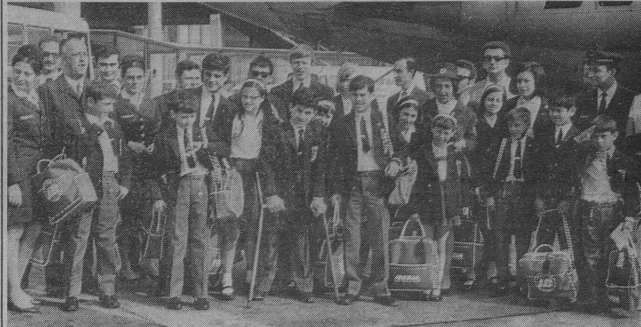
Madrid.—Los niños de la Operación Plus Ultra, tras su breve estancia en Madrid han salido del aeropuerto de Barajas camino de Roma, donde serán recibidos por Su Santidad Pablo VI. En el itinerario europeo de los pequeños se encuentra también este año Yugoslavia.—(Telefoto Europa Press)

El programa en Italia comenzó hoy con su llegada a Roma y comprende audiencia con el Santo Padre mañana, miércoles, y visita a la Fundación Guisepina Saragat; el jueves visita al palacio del Quirinal, entrevista con el alcalde de Roma y salida para Yugoslavia el próximo día 5, viernes.—Efe.