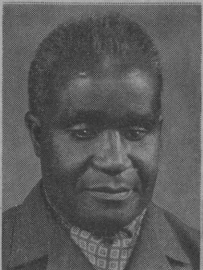
Kenneth Kaunda, Presidente de Zambia, que ha procedido a un cambio de Gobierno en el país y ha tomado el mismo el cargo de ministro de Negocios Extranjeros. También era ya ministro de Defensa