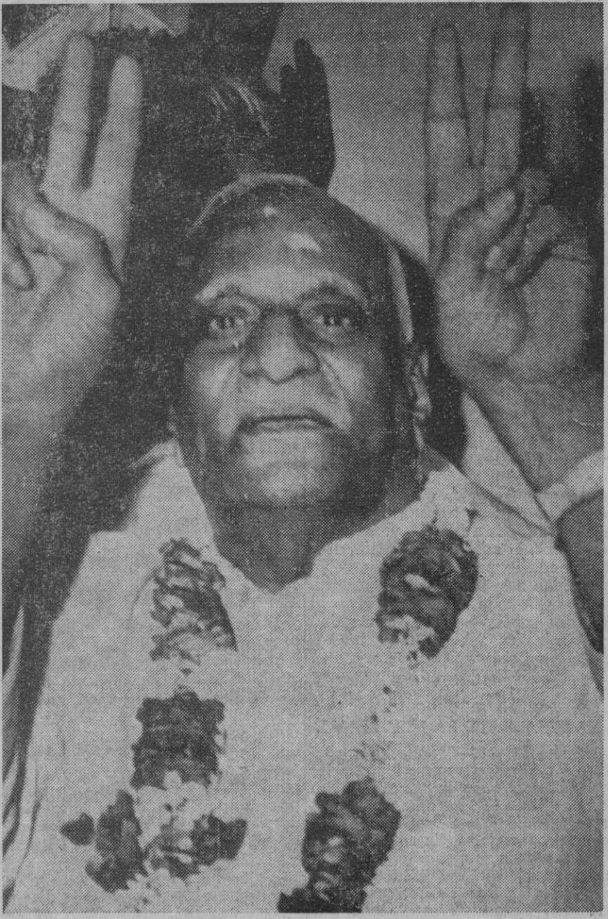
Nueva Delhi.—Apoyado por Indira Ghandi y todo su partido de la izquierda, V. V. Giri ha sido elegido nuevo presidente de la India.