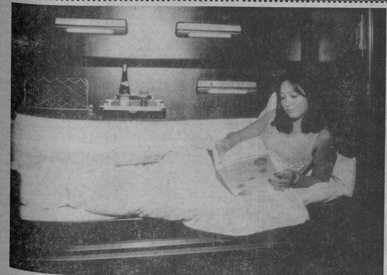
Los coches-camas en la República Federal de Alemania son considerados los más confortables de la Europa Occidental. Nuestra foto muestra un compartimiento individual en uno de los modernos coches con instalación de acondicionamiento del aire. Por eso no es de extrañar que incluso automovilistas apasionados utilicen para sus viajes de negocios los «hoteles rodantes». Sólo en los primeros tres meses del año en curso viajaron veinticinco mil pasajeros más en coche-cama que en el mismo periodo del año pasado.

Los disturbios comenzaron al final de los servicios religiosos cuando varios centenares de jóvenes