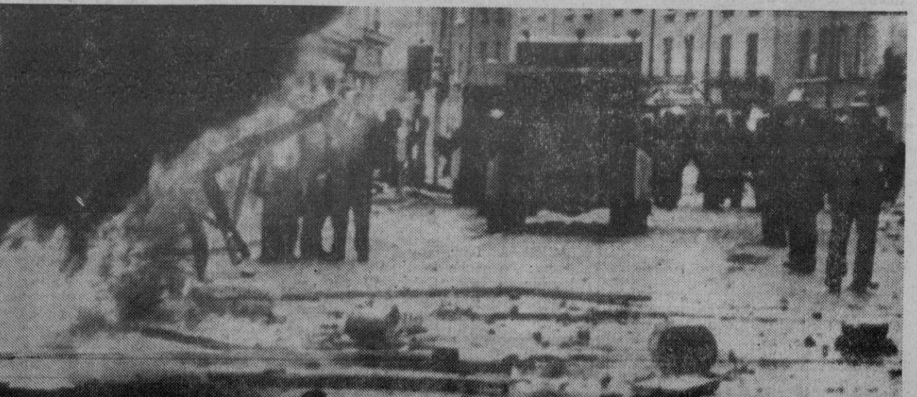
Londonderry.—El fuego destruye un edificio y la calle está cubierta de piedras lanzadas por los manifestantes en los disturbios ocurridos en Londonderry.—(Telefoto AP-Europa Press)

Bernadette Devlin, de 23 años, diputado y dirigente de la campaña de los derechos civiles, dirigió anoche un llamamiento al Gobierno de Londres para pedirle que suspenda la Constitución de Irlanda del Norte y se haga directamente cargo de la provincia.—Efe.