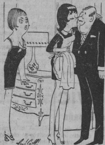
—María, la dije que fuese atenta con los invitados, pero no tanto...

Antes de comprar su FRIGORIFICO, vea un Westinghouse en Casa Solera