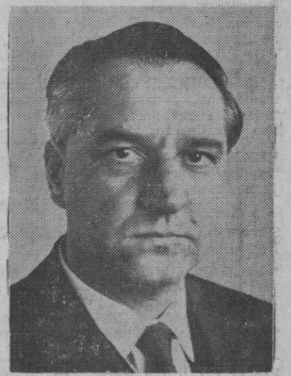
Samuel Silkin, miembro del Parlamento británico, que ha sido nombrado candidato social-demócrata al puesto de secretario general del Consejo de Europa

Se ha concedido a los trabajadores un aumento de ochocientas pesetas mensuales de las mil que habían solicitado y serán estudiadas algunas reivindicaciones.—Cifra.