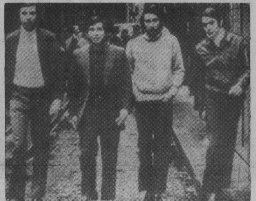
La cruda realidad de "esas" calles que existen en todas las ciudades del mundo ha sido vertida en una letra a la que el conjunto "Lone Star" ha puesto una música y una interpretación en la línea pegadiza y rítmica que caracteriza los éxitos populares de la imperante música ligera, pero sin mermar para ello el peso específico, el contenido social, la calidad poética, el mensaje, en suma, que la misma contiene. "Mi calle" se trata de una de esas rarísimas excepciones que logran el beneplácito de los adolescentes, el asenso de la crítica (todos la han tratado elogiosamente), se convierten en superventas (está subiendo en todas las listas de España y Suramérica) y, al mismo tiempo, su letra es capaz de resistir el análisis más severo en cuanto a calidad, contenido y mensaje.

Bakhtiar, que fue detenido el pasado año a su llegada a Líbano con armas de fuego, fue puesto en libertad recientemente, según se informa. Efe-Reuters.