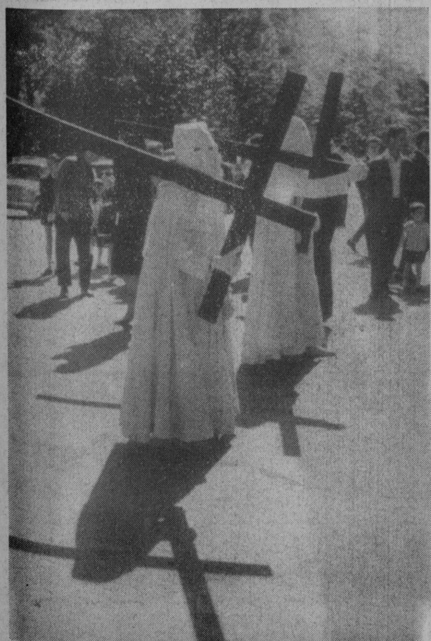
Sevilla.—Han comenzado en esta ciudad andaluza las tradicionales procesiones de Semana Santa, con el clásico esplendor y magnificencia, que hacen de estas procesiones unas de las más populares en todo el país e incluso en muchos puntos del extranjero. En el presente año participarán más de cincuenta cofradías con un total de ciento tres pasos.

Sede de las Naciones Unidas, 2.—A pesar de la falta de confirmación oficial por parte de los países interesados, ciertos medios diplomáticos han manifestado hoy que las conversaciones de los «cuatro grandes» sobre Oriente Medio comenzarán mañana por la tarde. Al decirse con insistencia por parte de los Estados Unidos que dichas conversaciones tendrán carácter no oficial y se harán esfuerzos para evitar una «atmósfera de conferencia», los medios informativos dijeron que las conversaciones iniciales tendrían lugar en el domicilio del embajador francés, Armand Bernard, en vez de en la Embajada francesa.—Efe-Upi.