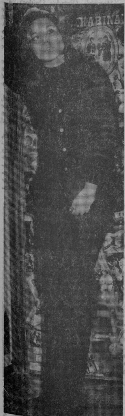
Sigue ascendiendo las «Flechas del amor», de Karina, en todas las listas de éxito. Y el «lanzamiento», por los síntomas va a durar. Tampoco pierde puntos «La fiesta».