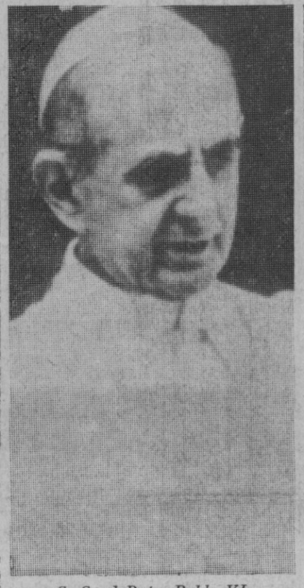
S. S. el Papa Pablo VI

Así afirma Su Santidad el Papa Pablo VI en su mensaje enviado, a través del secretario de Estado vaticano, cardenal Amleto Cicognani, a las A. C. L. I., con motivo de la jornada de la asistencia social, que se celebra el próximo día 19 de marzo.