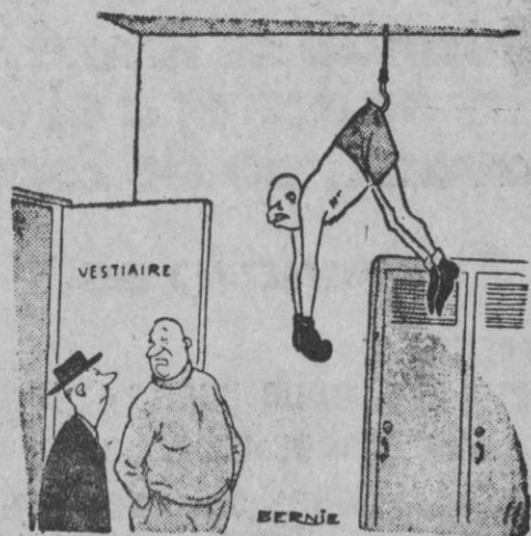
—¡La Federación de Boxeo le ha suspendido por un mes!

EN TELEVISION puede estar seguro si es Westinghouse CASA SOLERA