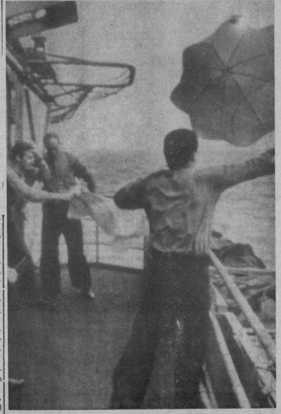
Miembros de la tripulación del portaviones «US Guadalcanal» hacen unas pruebas para establecer las condiciones reales del lugar en que ha de amerizar la cápsula «Apolo 9» con los tres astronautas a bordo. Fuertes vientos y gigantescas olas baten la zona, haciendo muy peligrosa la operación de rescate.

Los planes de los tres astronautas —James McDivitt, David Scott y Suresh Schweickart— durante el día de hoy consisten en seguir tomando fotografías de la Tierra.—Efe-Reuter.