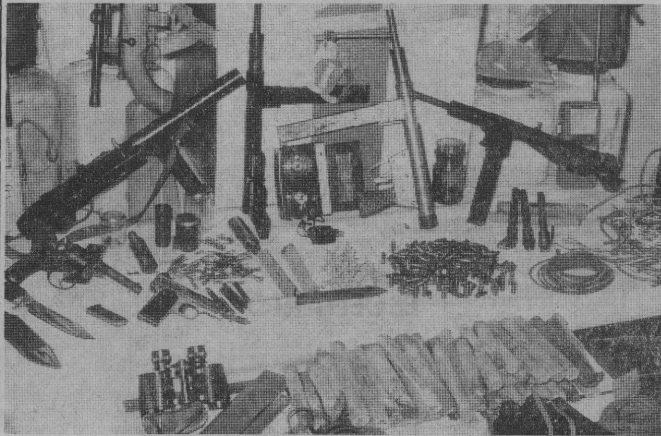
Sah Sebastián.—Esto es parte del arsenal de armas y explosivos que miembros de la policía gubernativa de Guipúzcoa han capturado. Todo el material formaba parte de dos depósitos de armas que miembros de la ETA escondían en Oñate y Mondragón. Los activos servicios de la Policía han permitido la desarticulación de un grupo, del que se han capturado cuatro individuos, aparte del importante alijo de armas.

Madrid, 10.—Una nueva planta azucarera, capaz de moltar tres mil toneladas al día de remolacha, acaba de ser autorizada para su instalación en Arcos de la Frontera (Cádiz).