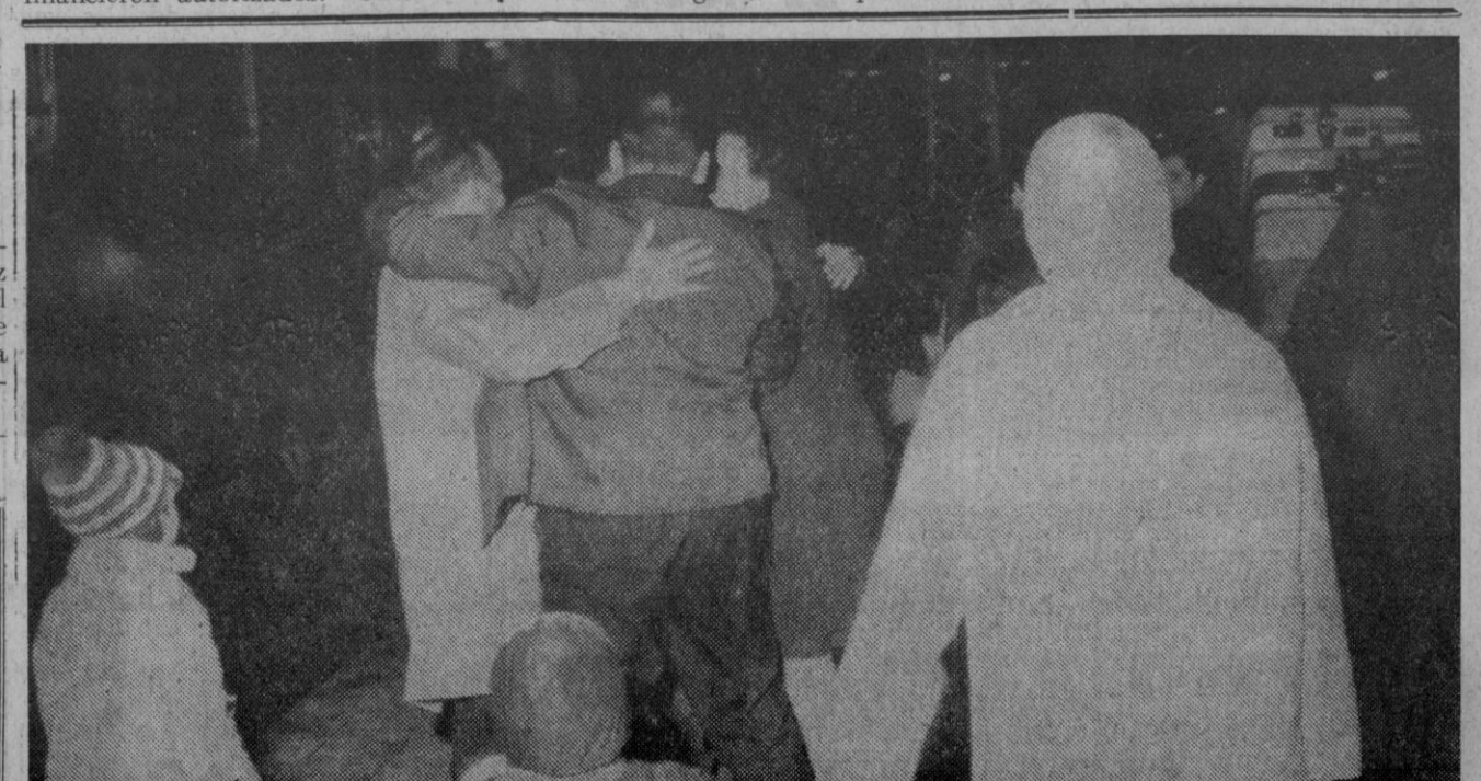
Madrid.—Han llegado ya, en el primer tren especial, los emigrantes españoles que regresan para pasar con sus familias las próximas fiestas navideñas. Aquí como los abrazos en la estación ferroviaria.

Madrid, 10.—La cotización registrada hoy por el franco francés billete en el mercado libre de divisas de Madrid, fue de 13,20, según informan a la agencia "Cifra" círculos financieros autorizados.—Cifra.