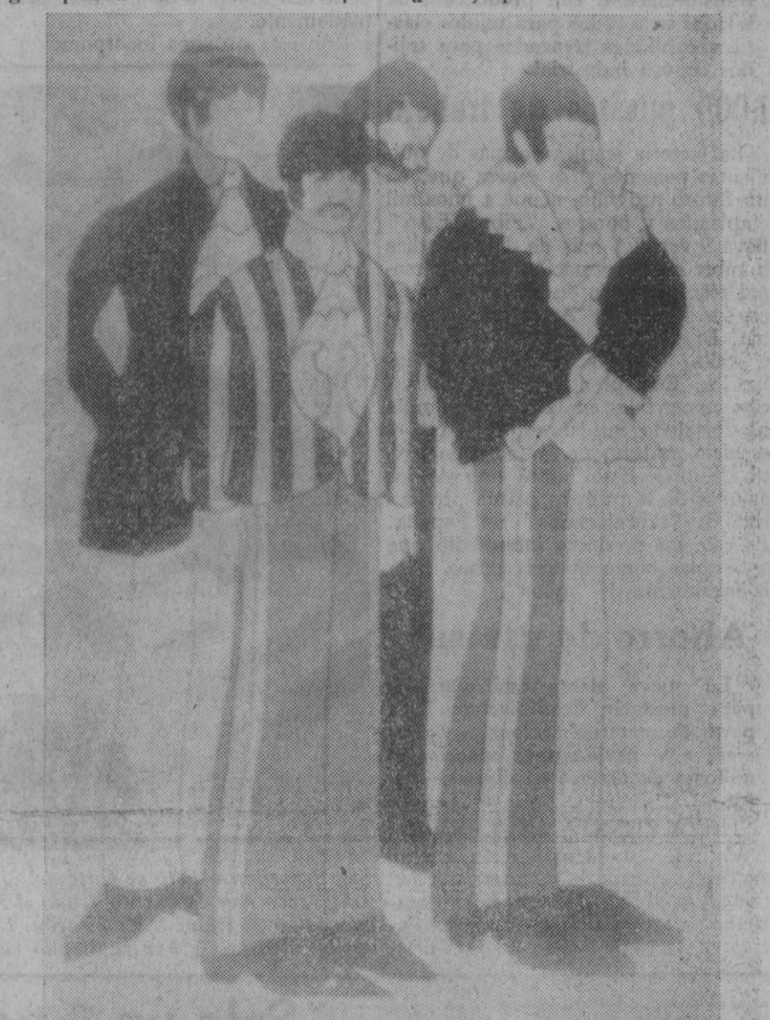
Cartel publicitario de la película de los Beatles, "El submarino amarillo".

En suma, una brillante realización de Heinz Edelmann y una buena dirección a cargo de George Dunning. En realidad es una buena película no para la gente que la hizo, sino para la gente que la ve y quiere disfrutar de noventa