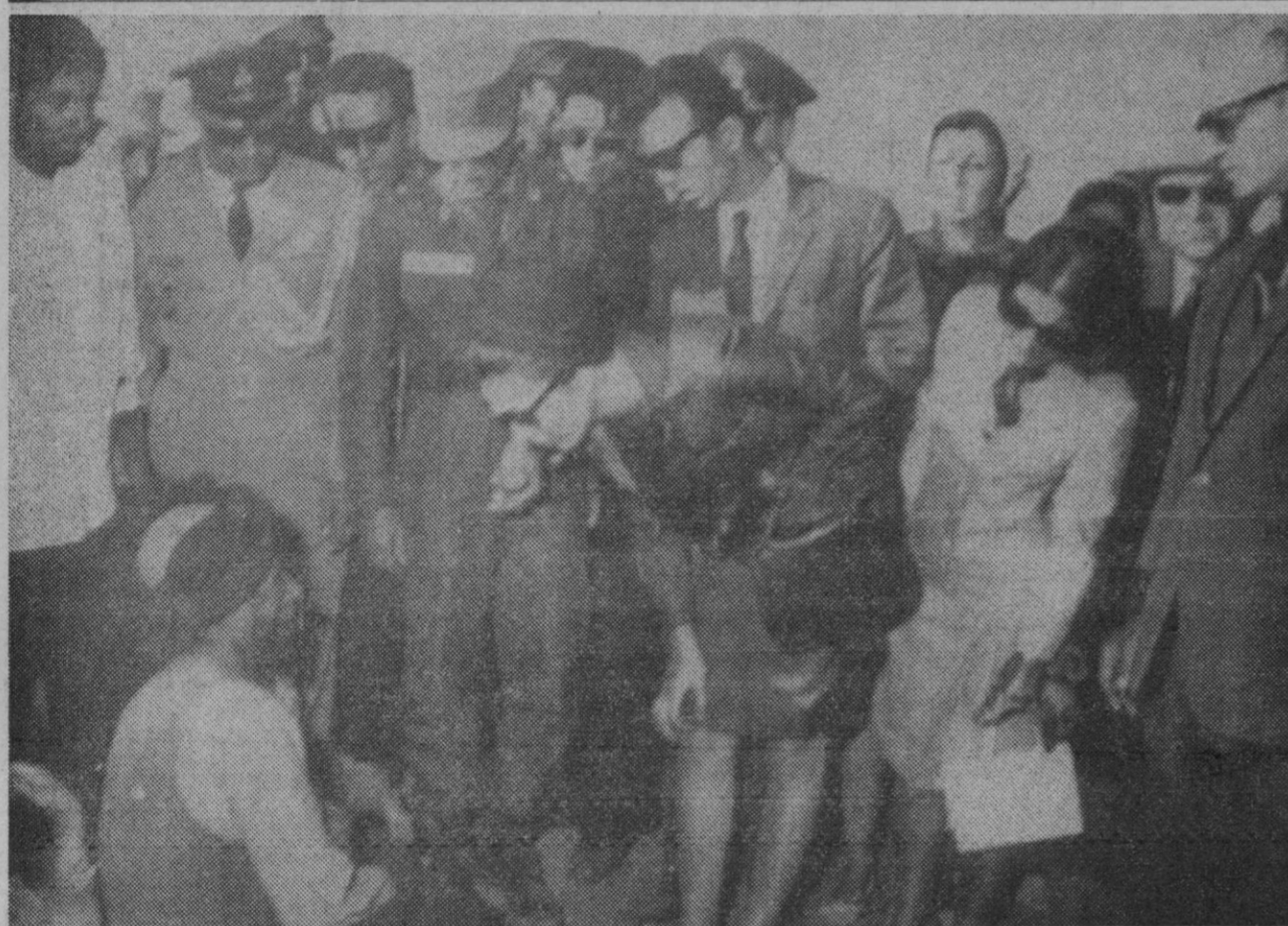
Birjand.—El sha de Persia con su esposa la emperatriz Farah hablando con un anciano de 68 años en la zona devastada cerca de Birjand.

Alicante, 5.—La serie octava del número 18.260 a la que le han correspondido en el sorteo del turista celebrado esta noche en Murcia cuarenta millones de pesetas, ha sido vendida completa en la administración de Loterías número 1 de esta ciudad, sita en la calle Mayor, número 5. Se ignoran aún quiénes han sido los afortunados poseedores de dicho número y serie.—Cifra.