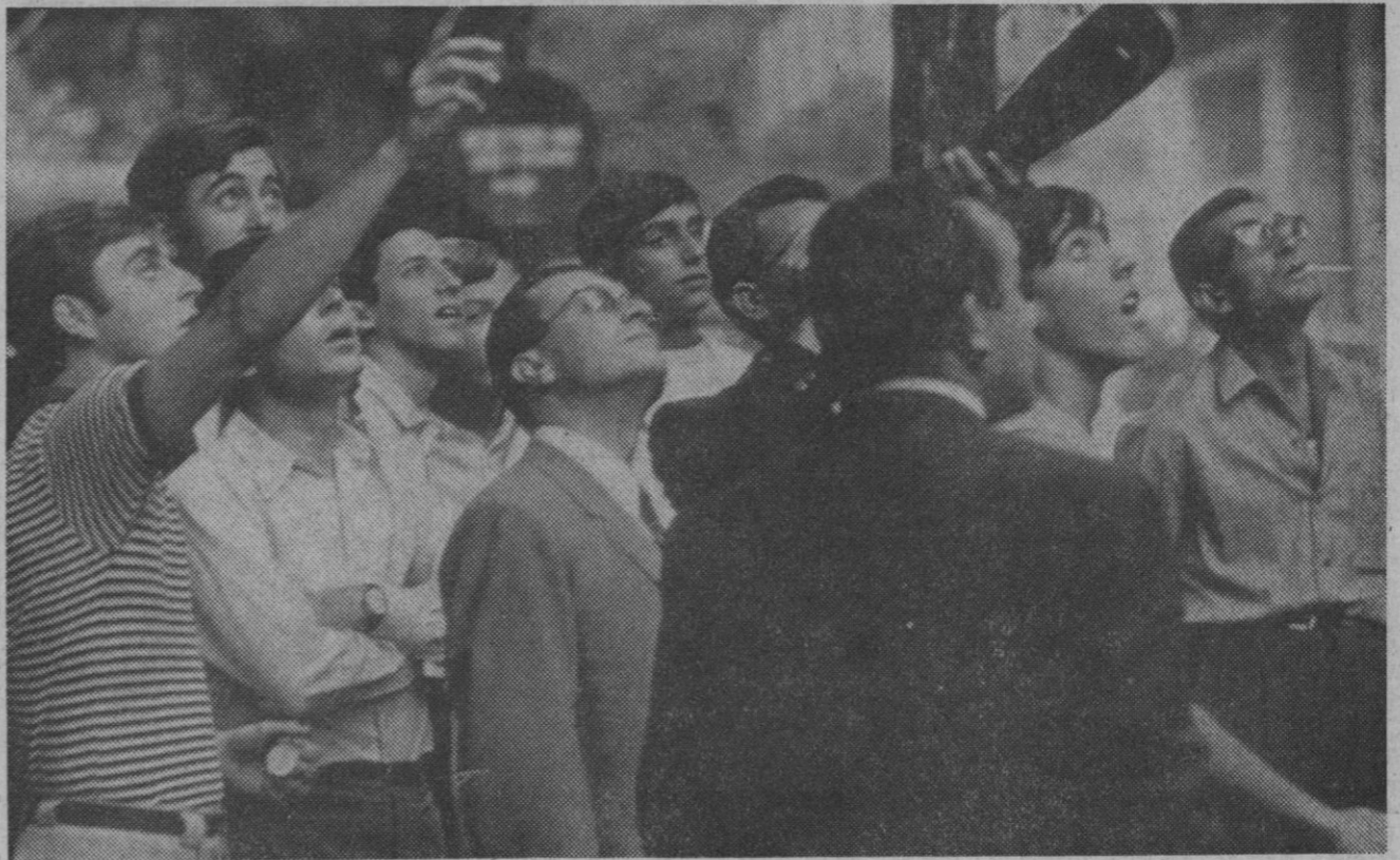
Madrid.—Un nutrido grupo de transeúntes contemplan desde la calle de Serrano, entre Hermosilla y Ayala, un extraño objeto que desde las siete a las siete y media de la tarde del jueves, 5 de septiembre, fue observado en el cielo de Madrid. Ni el Observatorio Astronómico, ni el Centro de Meteorología, ni el aeropuerto de Barajas, ni los radares del Centro Aeroespacial de Torrejón de Ardoz habían identificado ni la naturaleza ni el origen del objeto.

Madrid, 6.—Normalizada la situación monetaria francesa con la supresión del control de cambios y la convertibilidad del franco francés, se ha normalizado, también, según fuente autorizada del I. E. M. E. el mercado del franco francés-billete en España. El franco francés-billete que hasta ahora no tenía cotización oficial y sobre el que existía simplemente un tipo de cambio indicativo, a partir de ahora tendrá su normal cotización oficial fijada en esta fecha en 13,90 para venta y 13,97 para compra.—Cifra.