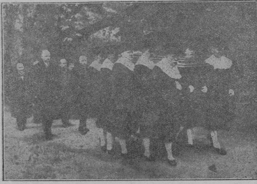
Conducción del cadáver del Príncipe Bulow a su sepultura, en Flottbeek, adonde habían sido trasladados los restos del ex Cancellor del Imperio alemán, que falleció en Roma.