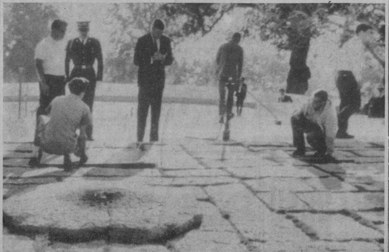
Washington.—Personal del cementerio nacional de Arlington tomando medidas para el entierro del senador Robert Kennedy, que será enterrado junto a su hermano John, muerto también asesinado el 22 de noviembre de 1963.

A la viuda del fallecido senador, el señor Iturmendi ha enviado el siguiente mensaje: "Hondamente impresionado por el trágico fallecimiento del senador Robert F. Kennedy, que constituye una nueva y triste contribución de esa familia a los ideales de paz y comprensión entre todos los hombres, las Cortes españolas y su presidente se solidarizan muy de corazón a su dolor. Atentamente, Antonio Iturmendi, presidente Cortes españolas"