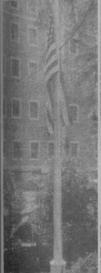
Madrid.—Un "marine" saluda militarmente ante el mástil en el que ondea a media asta la bandera norteamericana, en la Embajada de Estados Unidos, como homenaje a Robert Kennedy.

Londres, 7.—Los «Beatles» siguen asombrando al mundo con sus ocurrencias. La nueva genialidad es que han decidido quitarse las pelucas y abrir un salón de peluquería para caballeros, que estará instalado en la King's Road, calle muy de moda en el barrio de Chelsea en Londres.—Efe.