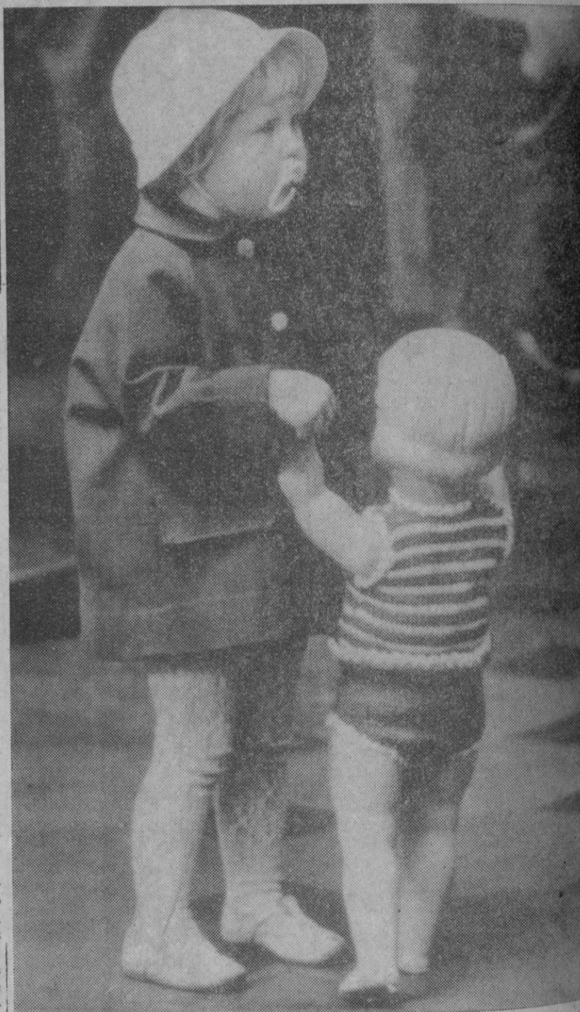
Nada tan claro y limpio como la intención y los actos de un niño. Cuando somos jóvenes no podemos evitar el querer hacernos hombres, pero a la larga se nota nuestro infantilismo; sin embargo, cuando somos hombres añoramos aquel primer balón que nos trajeron los Reyes, la pistola de agente secreto, la cocinita de la hermana más pequeña, los cacharritos revueltos siempre en una caja vieja de zapatos, la muñeca... Esto no es una fotografía, es un recuerdo no deben llevar más que una pequeña advertencia: Sin palabras.

Finalmente, se examinó y aprobó en la reunión—celebrada bajo la presidencia del director del servicio, señor De la Fuente—el trabajo realizado por una ponencia específica, en el que se señalan los criterios a seguir para mejorar las semillas selectas de trigo, y procurar el reajuste de la producción.—(Cifra).