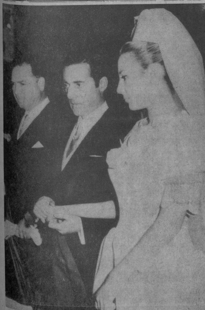
Guadalupe (Cáceres).—El exmatador de toros Miguel Báez "Liri" y la señora María de la Concepción Spinola, reciben, con las manos cruzadas, la bendición del sacerdote durante la ceremonia de su enlace matrimonial. "El Liri" dijo después que estaba más nervioso en aquel momento que en el día de su alternativa.

El portavoz ha añadido: «No se trata de una maniobra para lanzar el asunto Tshombé a la escena internacional.» «Tshombé se encuentra en buen estado de salud y está siendo bien tratado.» —Efe.