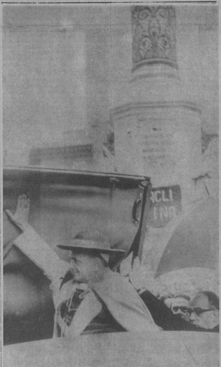
Roma.—El Papa Pablo VI descubre la capota de su automóvil, a pesar de la lluvia, al terminar de orar ante la estatua de la Inmaculada Concepción en la Piazza de Spagna, de Roma. Ha sido la primera vez que el Papa ha salido del Vaticano desde la operación de la próstata que sufrió el pasado 4 de noviembre.

Albania está alineada con China roja en la disputa ideológica que enfrenta, dentro del mundo comunista, a Pekín y Moscú.—Efe-Upi.