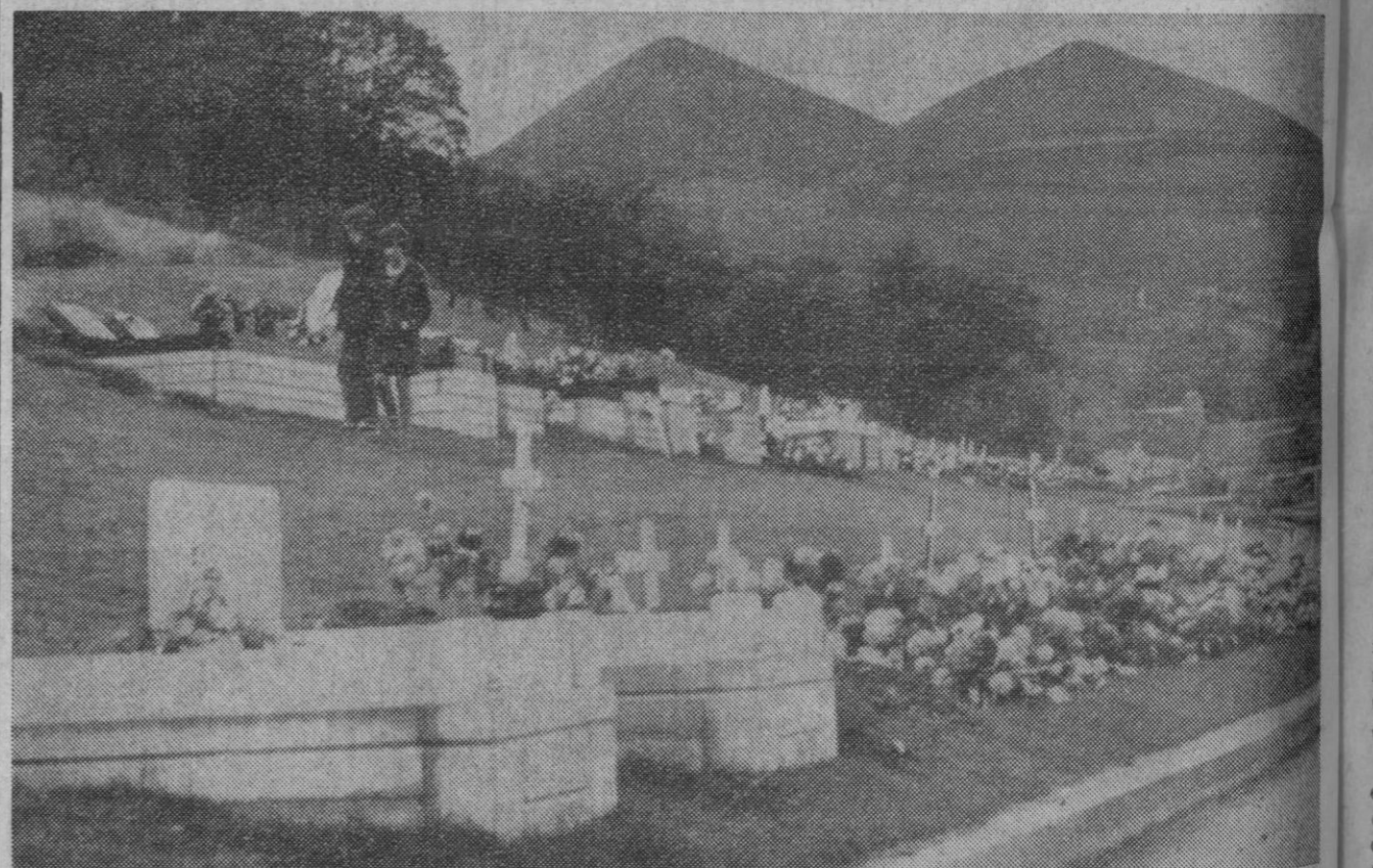
Aberfan.—Las tumbas cubiertas de flores donde están enterrados los ciento dieciséis niños y veintiocho adultos que perdieron la vida el 21 de octubre de 1966, aparecen enmarcadas por dos montañas de escorias, similares a aquella cuyo deslizamiento provocó una de las catástrofes peores del siglo, que ha dejado casi sin niños este sufrido poblucito de Aberfan.—(Foto Ap-Europa Press.)

El agua de mar contiene, diluidas, soluciones de casi todos los elementos que se encuentran en la tierra, según la mencionada sociedad.