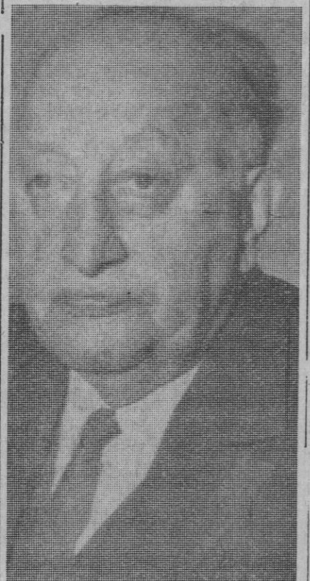
Paris.—Miguel Angel Asturias, ahora embajador de Guatemala en Paris, después de conocer la noticia de haber obtenido el premio Nobel de literatura

Isabela (Filipinas), 22.—Un temblor ha sacudido el pueblo de Ilagan, en esta provincia, en el extremo norte de Luzón, a las 5,08 de hoy (21,08 hora local), temblor que duró dieciséis segundos y sembró el pánico en la población, aunque no hay informes de desgracias personales o daños materiales.—Efe.