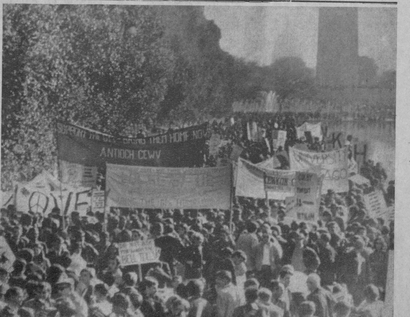
Washington.—Los manifestantes contra la guerra del Vietnam, concentrados en los alrededores del Memorial Lincoln. Al fondo, entre las abundantes pancartas pacifistas, la base del monumento a Washington y la cúpula del Capitolio.—(Telefoto Ap-Europa Press.)

La agitación estudiantil en la Universidad madrileña se corresponde con los movimientos del mismo signo desatados en estas fechas en los recintos universitarios de distintas capitales europeas y americanas, y obedece a consignas difundidas por movimientos de clara tendencia comunista.—Cifra.