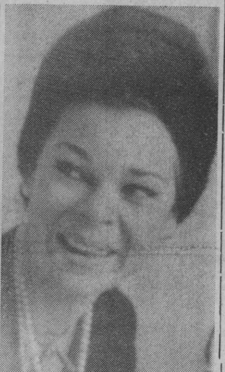
La princesa Beatriz de Saboya y Mauricio Arena, que han contraído matrimonio civil, recientemente. La ceremonia religiosa tendrá lugar próximamente, al parecer.