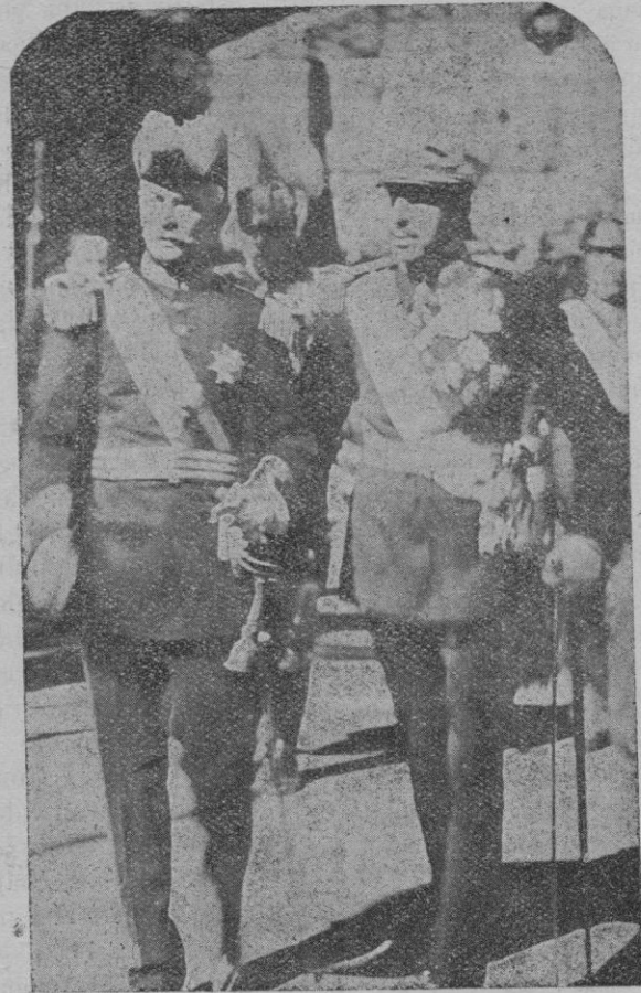
El presidente de Portugal al llegar a Madrid, saliendo de la estación del Norte acompañado de S. M. el Rey Alfonso XIII