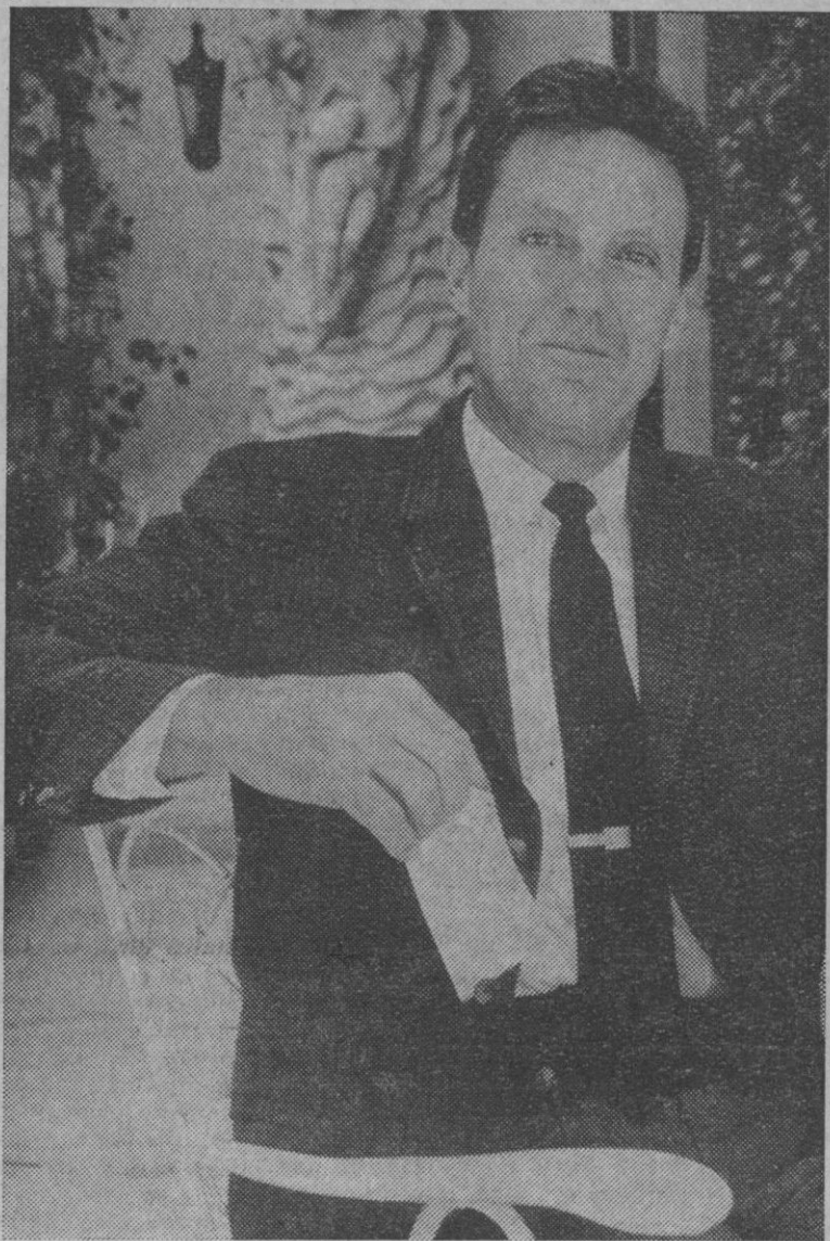
Madrid.—El actor cinematográfico y de la televisión Robert Stack, en el hotel de Madrid donde se hospeda durante su estancia en la capital. Robert Stack es conocido por la interpretación del papel del agente Elliot Ness de la serie "Los Intocables".