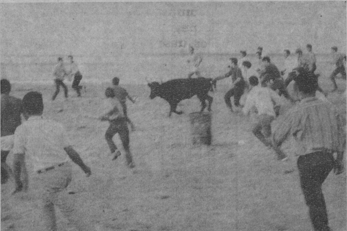
Benicarló (Castellón).—La "España insólita": Ante el asombro y expectación de unos tres mil turistas de todas las nacionalidades, los mozos de Benicarló corren por la playa a una vaquilla. Son los tradicionales "bous de vila". La res baja desde el castillo, es torreada en la plaza por los mozos y el "encierro" (pero al revés), termina junto a las aguas del Mediterráneo.

El Ministerio indio de Defensa, ha indicado hoy que no había recibido informes de actividad en la zona desde ayer por la mañana.—Efe-Reuters.