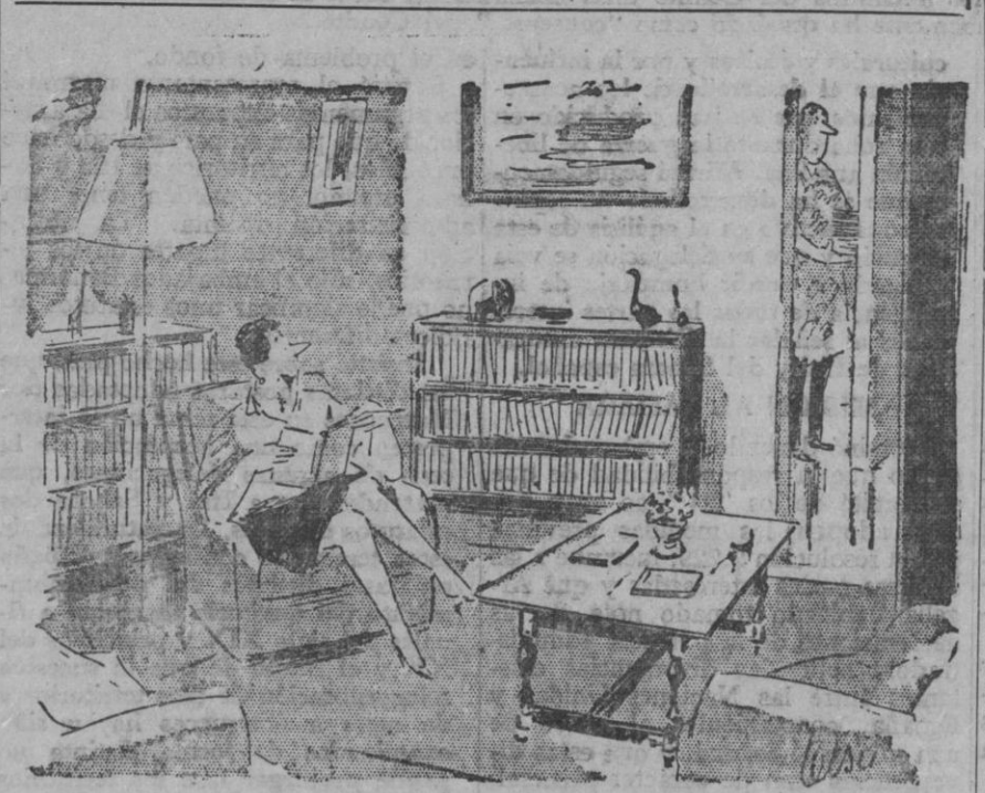
—La novela acaba bien... termina en matrimonio...