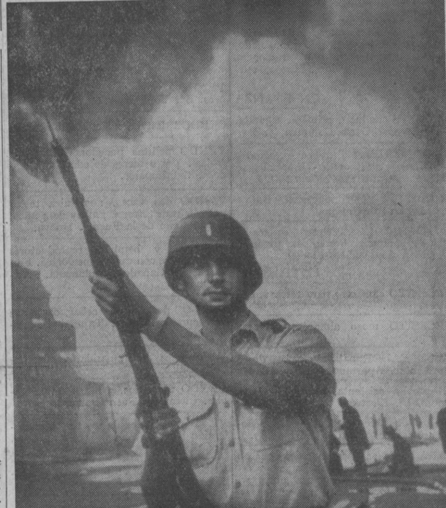
Detroit.—Un miembro de la guardia nacional de Michigan monta guardia mientras los bomberos luchan contra uno de los muchos incendios provocados en Detroit durante los alborotos.

Detroit (Michigan), 24.—Una división entera de la guardia nacional, con un total de siete mil hombres ha recibido la orden de entrar en la ciudad de Detroit, quinta en importancia de los Estados Unidos, donde tres personas han resultado muertas a tiros durante la pasada noche, en una revuelta negra de extrema violencia.