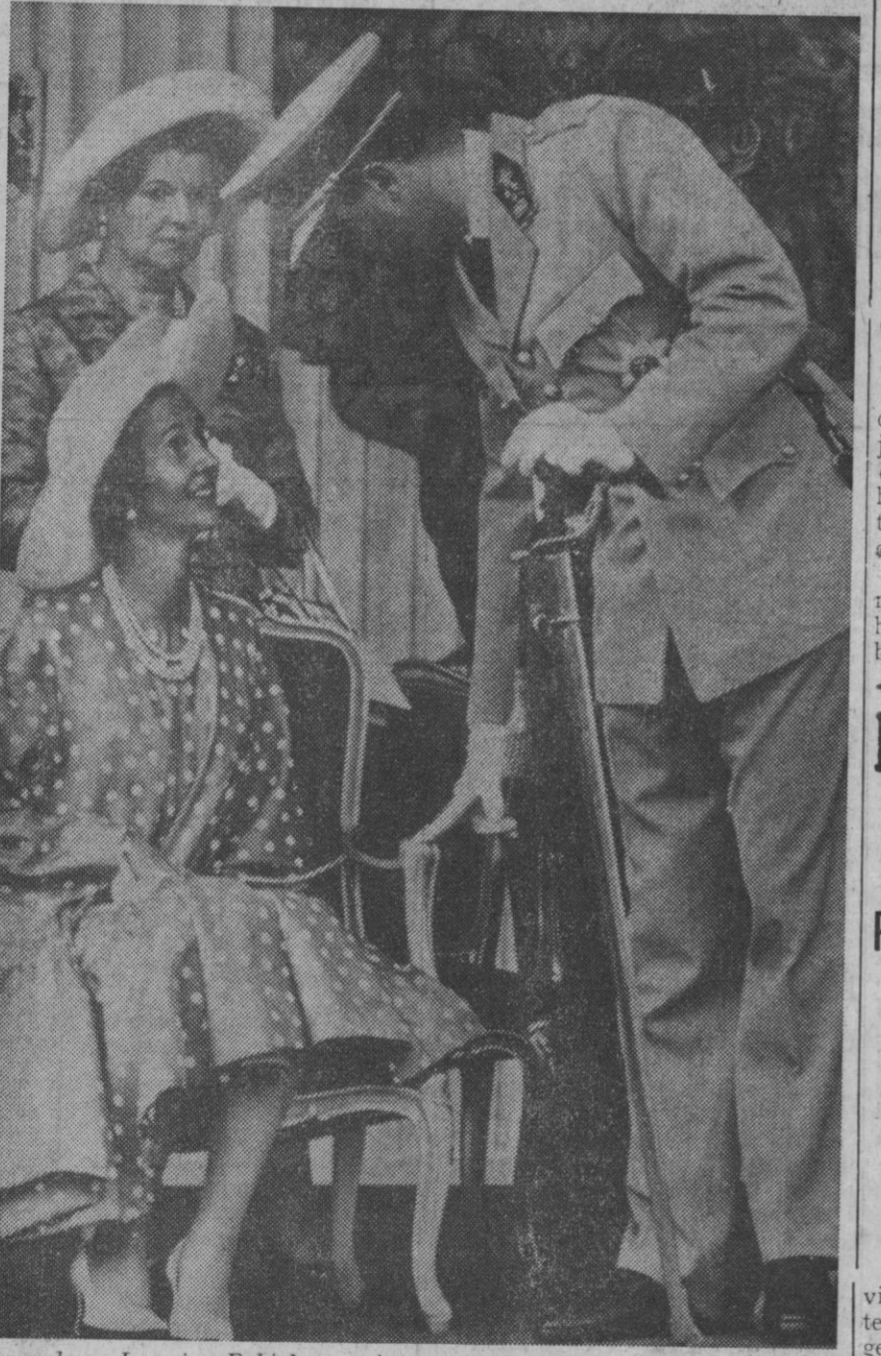
Bruelas.—La reina Fabiola—¿quizá en estado de buena esperanza?—charla sonriente con el rey Balduino durante la parada militar que se desarrolló en esta capital con motivo de la fiesta nacional belga.

El numeroso público que se hallaba congregado en las inmediaciones del pazo hizo objeto de cariñosas demostraciones de adhesión y simpatía al Jefe del Estado y su esposa.—Cifra.