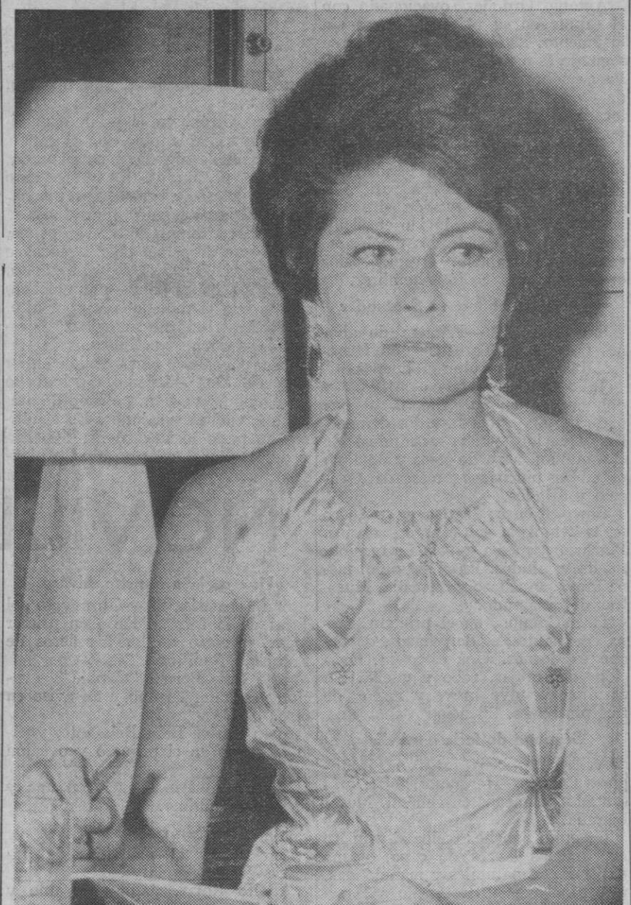
Después de sus experiencias cinematográficas, Soraya ha vuelto a su mundo.

Todo ocurrió en el aeropuerto romano de Fiumicino poco antes de que la princesa tomara el avión que había de conducirla a Munich. Sólo un periodista había acudido para despedirla y solicitar de ella la contestación a una pregunta muy indiscreta: "Alteza, ¿es cierto que ha pedido más dinero al Sha? ¿Es cierto que V. A. se encuentra en dificultades económicas?". La pregunta era el resultado de un rumor surgido como consecuencia del retiro de Soraya de la "high society" de Roma en la que había entrado por la puerta grande y de la que había salido discretamente, casi de puntillas. Desde hacía unos meses apenas acudía a las recepciones, cocktails y fiestas. Y cuando lo hacía ningún hombre la acompañaba. Sólo una amiga llamada Gloria Massaudi. —No ha tenido ningún amigo des-