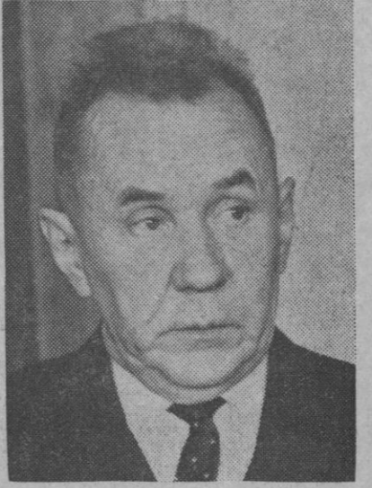
Alexei Kosyguin, jefe del Gobierno soviético, cuya visita oficial a Inglaterra ha sido seguida con vivo interés

El comunicado, aprobado por el Consejo de Estado y la comisión para asuntos militares, lleva el sello del Ministerio de Seguridad Pública, y en él se indica que la guarnición de Pekín ha establecido un control militar por medio de un comité para supervisar la seguridad pública.—Efe-Reuter.