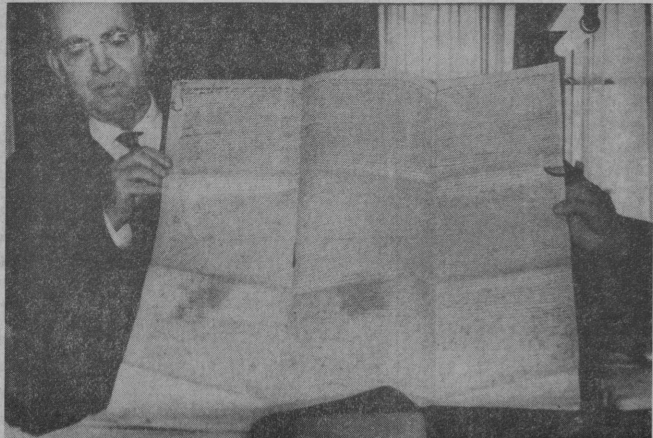
Zaragoza.—Pergamino encontrado en el derribo de unas obras que reúne todas las características de estar hecho con piel humana.

Nueva York, 12.—El satélite fotográfico norteamericano «Orbiter 3», se ha situado en una nueva órbita alrededor de la Luna, a sólo 46,2 kilómetros de su perigeo en virtud de la orden cursada por radio desde la Tierra que puso en funcionamiento un retrocoete para lograr la reducción de velocidad y su ulterior acercamiento a nuestro satélite natural, según se ha anunciado en un boletín de noticias de la televisión estadounidense. La misión encomendada a la nave espacial es la de fotografar 12 puntos considerados como más convenientes—según las recibidas anteriormente por sus predecesores—para el alunizaje de futuros astronautas. El navio dará por finalizada la toma de fotografías el día 22 del mes actual.—Efe.