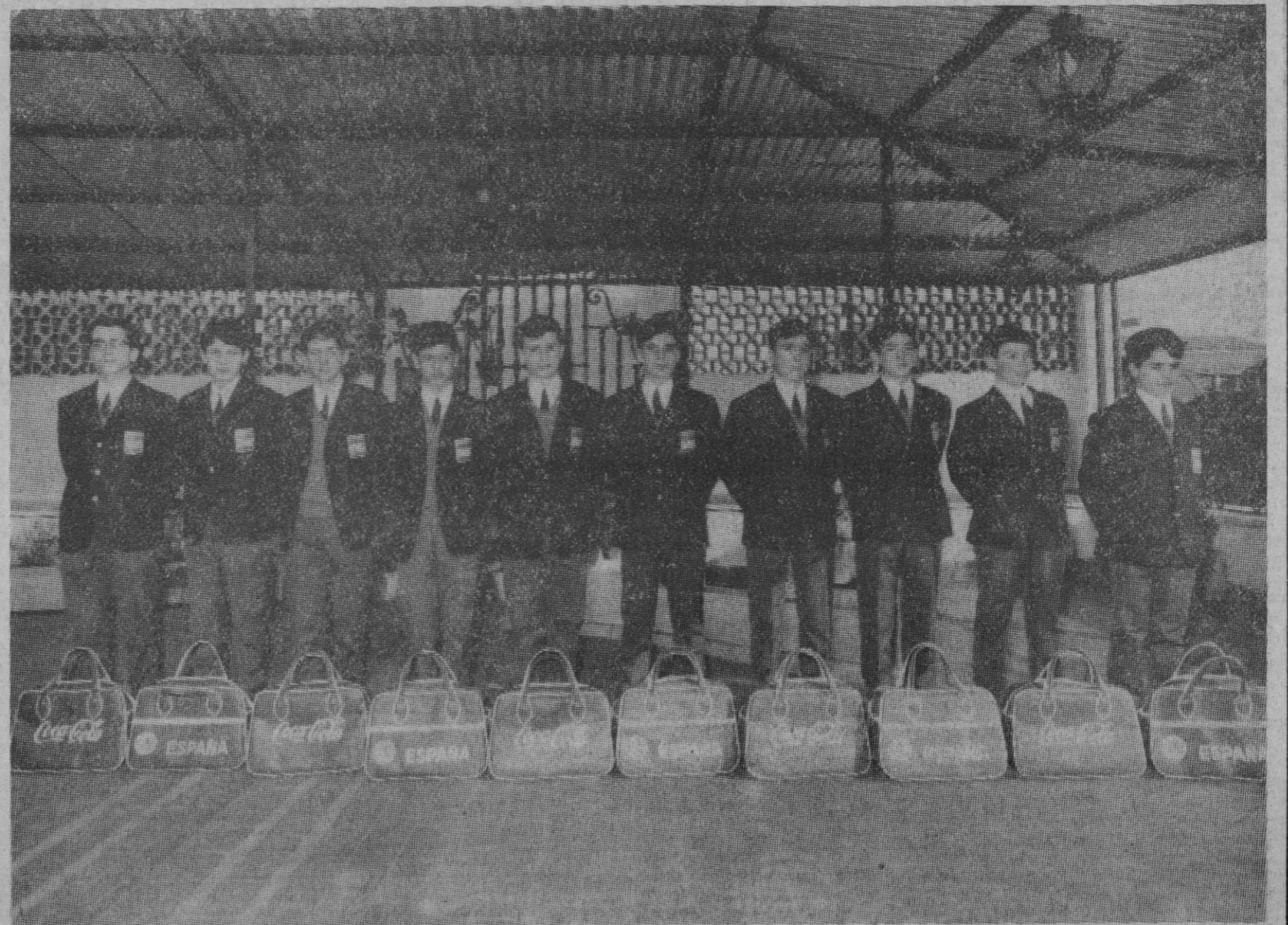
He aquí nuestra flamante selección nacional de mini-basket, que el próximo día doce saldrá para Pennsylvania a defender nuestros colores en el I Campeonato Mundial de esta especialidad deportiva. Como se puede ver los muchachos no pasan de los doce a trece años de edad.