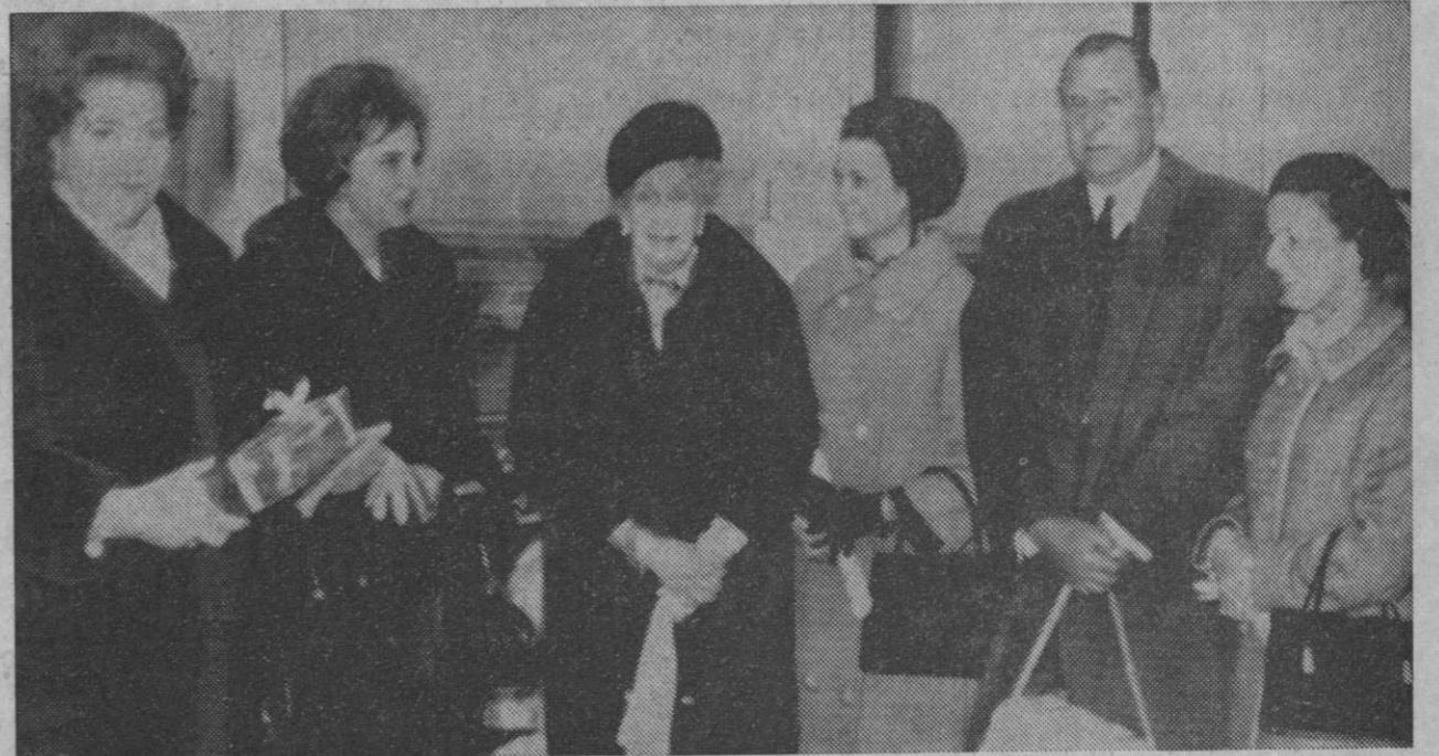
Niza.—El conde de Barcelona y su hija la princesa María del Pilar, son recibidos a su llegada a Niza por la princesa Gracia de Mónaco. De izquierda a derecha aparecen la condesa de Barcelona, María del Pilar, la Reina Victoria, Gracia de Mónaco, el conde de Barcelona y la princesa Antoinette de Mónaco.