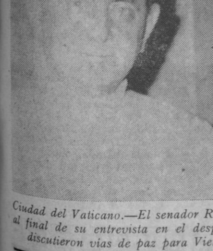
Ciudad del Vaticano.—El senador Robert Kennedy con el Papa, Pablo VI, al final de su entrevista en el despacho privado de Su Santidad, donde discutieron vías de paz para Vietnam.