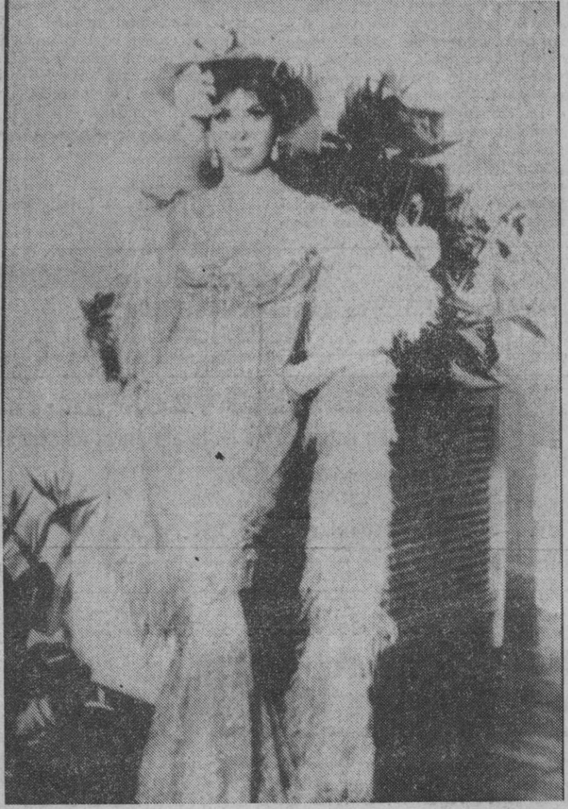
Río de Janeiro.—La estrella de cine italiana Gina Lollobrigida luce uno de los vestidos que llevará durante el carnaval de Río de Janeiro

Oficialmente no se confirman estas predicciones, pero están relacionadas con la reciente afirmación del secretario de Defensa Robert S. McNamara, según la cual los chinos podrían tener su primer prototipo de proyectil intercontinental en este mismo año de 1967 aunque un tanto primitivo.