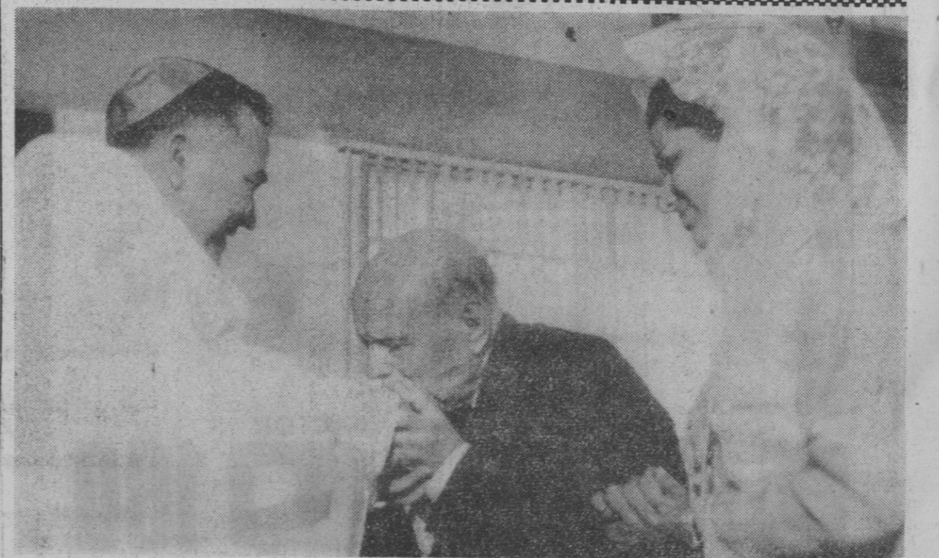
San Juan de Puerto Rico.—El famoso violonchelista español Pablo Casals besa el anillo del arzobispo Luis Aponte Montañes, después de una misa especial en San Juan con motivo de su noventa cumpleaños. A la derecha, la esposa del músico, Marta, de treinta años.

Los aviones partieron de bases en Vietnam del Sur y Tailandia y de portaviones de la Marina en el golfo de Tonkín. Las tripulaciones pintaron a mano en cierto número de bombas de 500 kilos el mensaje de fin de año.