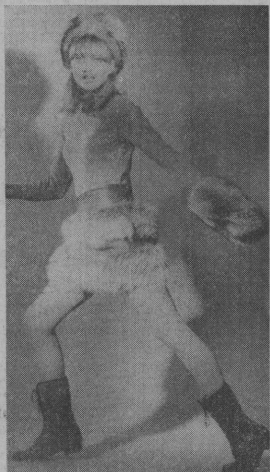
Minifalda de piel de zorro, de Roma y Roberta, que hace juego con el manguito y el gorro.

—Creo que estos forros sientan maravillosamente y se pueden llevar tanto en abrigos como en gabardinas e impermeables —me dijo Miss Chanelle—. Y, naturalmente, las gabardinas