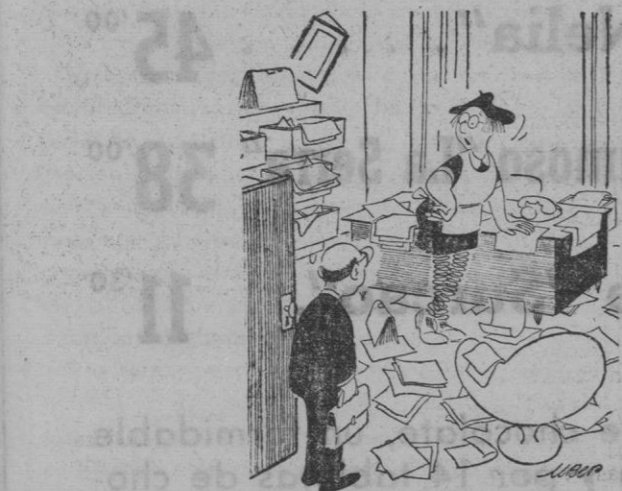
—¿No habrá visto usted mi plumero por ahí...?