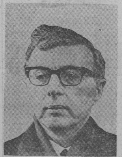
Jelle Zijlstra, nuevo ministro holandés de Negocios Extranjeros

Tass añade que este satélite es el último de la serie «Cosmos», iniciada el 16 de marzo de 1962 y que su altura máxima es de 662 kilómetros y su mínima a la Tierra de 259.—Efe.