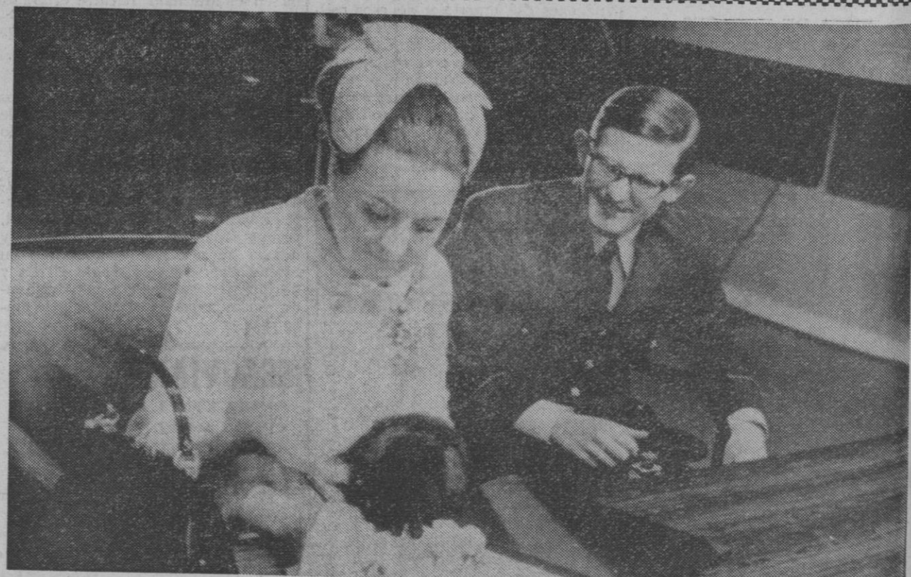
Baarn (Holanda).—La princesa Margriet de Holanda firmando en el registro de matrimonios durante la ceremonia matrimonial celebrada en el ayuntamiento de Baarn. A la derecha, su prometido, el doctor Pieter van Vollenhoven. La ceremonia se celebrará el próximo día diez de enero.

París, 13.—El secretario de Estado norteamericano, Dean Rusk, ha llegado esta mañana a París, por vía aérea, procedente de Teherán.—Efe.