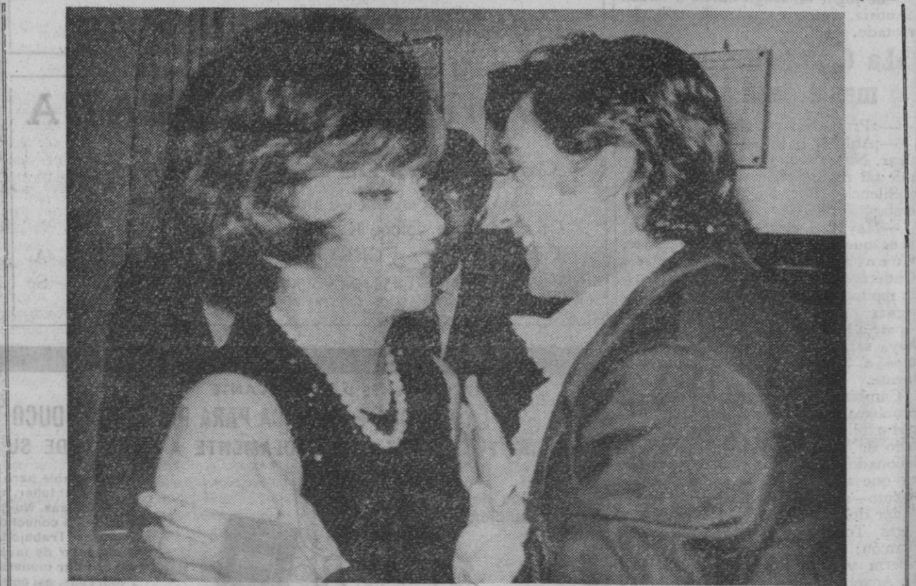
Madrid.—La estrella italiana Gina Lollobrigida, que se encuentra en Madrid, rodando la película «Cervantes», acudió al «Corral de la Morería», en donde estuvo hasta las cuatro de la madrugada viendo bailar al bailarín Antonio Gades. En la fotografía, Gades recibe afectuosamente a Gina a la llegada de ésta a dicho «tablao» flamenco.