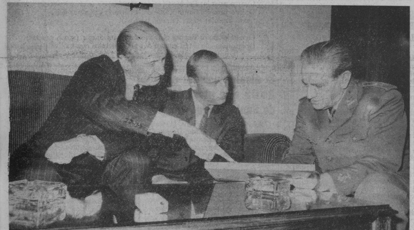
Madrid.—El vicepresidente del Gobierno, capitán general don Agustín Muñoz Grandes, el embajador de los Estados Unidos, Angier Duke, y el astronauta norteamericano Charles ("Pete") Conrad, con la bandera española que el último llevó en su último viaje espacial pilotando el "Gemini 11" y que entregó, dentro de un marco, al vicepresidente español.

El informe añade que el 40 por ciento de los judíos norteamericanos y canadienses que se habían trasladado a Israel, para residir allí, han regresado a sus respectivos países de origen.—Efe.