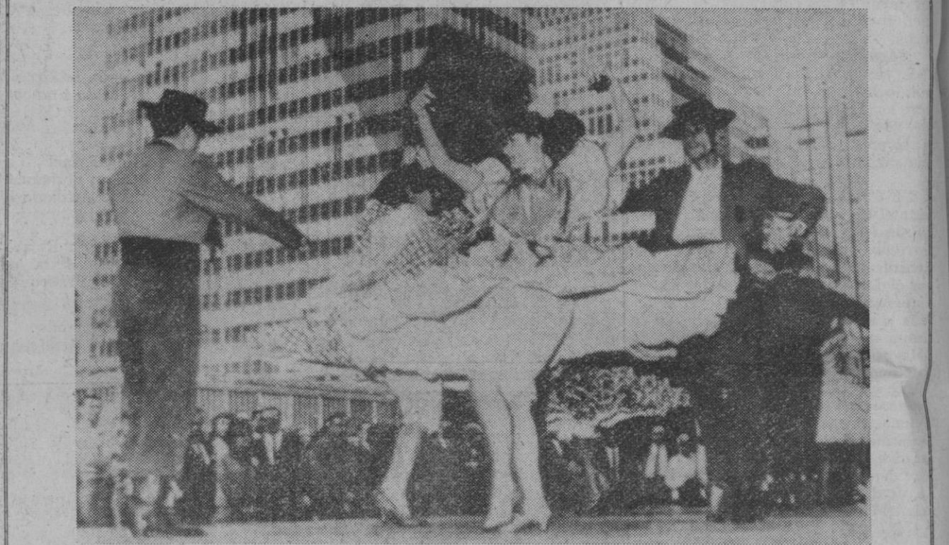
Nueva York.—Alegria de España en la ciudad de los rascacielos. Los Coros y Danzas actuando ante los transeúntes en la Calle 52 y la Avenida del Parque. Así comenzó la Semana de España, del 8 al 15 de octubre.

La propuesta británica interfiere, por tanto, en la recomendación que (Continúa en la página 4)