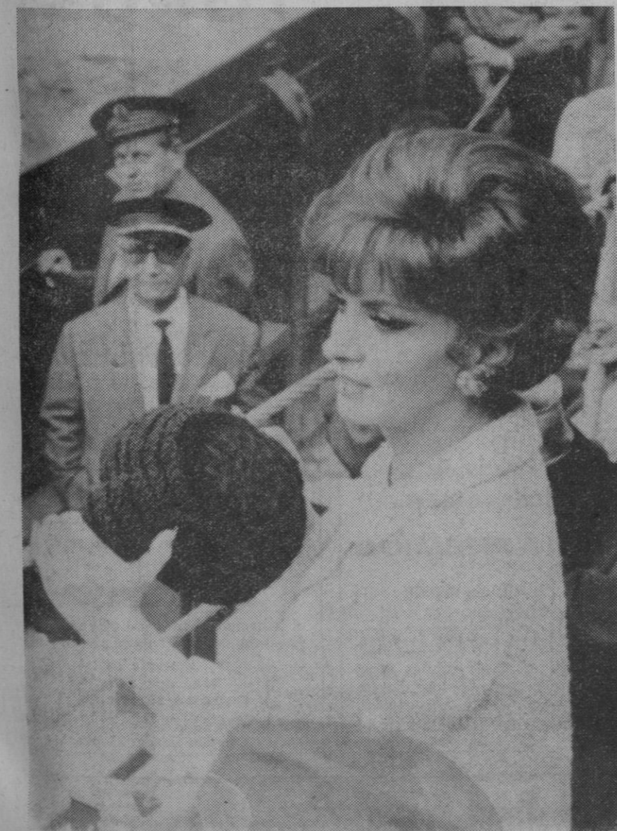
Madrid.—La estrella italiana Gina Lollobrigida, que se encuentra en Madrid rodando la película «Cervantes», fotografiada en la novillada del domingo en la plaza Monumental, con la montera del torero Federico Navalón «El Jaro», que le brindó un toro.

Catania, 11.—Ha entrado nuevamente en actividad el volcán Etna, que anoche despertó a los habitantes de la región con violentas explosiones.