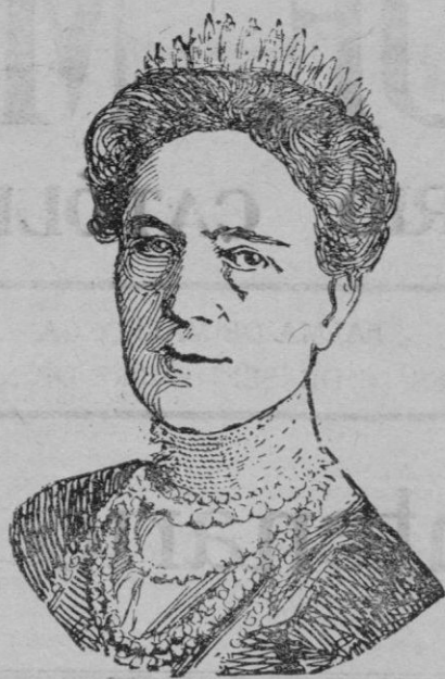
La Reina Victoria de Suecia que ha mejorado algo en la grave enfermedad que hace tiempo padece.

les; y dando por terminada la suscita exposición de antecedentes, abordó el desarrollo de su tema o sea "Exposición de datos sobre el régimen municipal de la Ciudad y Reino de Mallorca desde la reconquista hasta nuestros días, y sobre algunos acontecimientos importantes con dicho régimen relacionados".