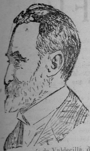
El señor Marqués de Valdecilla, distinguido filántropo santanderino que ha regalado 14 millones para un hospital a la capital montañesa.