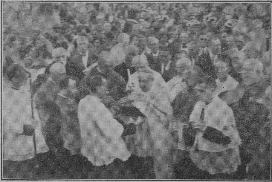
Nuestro ilustre paisano el Excmo. Sr. Obispo de Barcelona, Dr. Miralles, efectuando la bendición de la cruz erigida en el sitio donde desembarcaron las huestes de Jaime I

Nuestro vasto hipódromo presentaba magnífico golpe de vista, ocupado total-