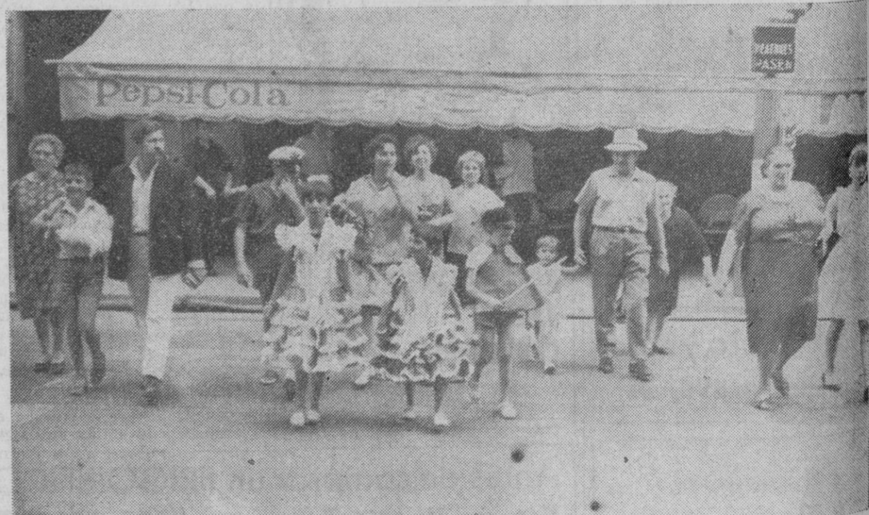
Sevilla.—A diferencia de tanto turistas extranjeros vestidos estrafalariamente, estos pequeños visitantes eligieron trajes más en consonancia con el marco, vistiendo en pleno agosto atuendos de sevillanos, gitanos y hasta toreros, en una especie de imitación de los personajes de "Carmen". Despertaron las simpatías de los sevillanos.—(Foto Europa Press).

con la China roja prosiguiendo el «escalamiento» de la guerra del Vietnam.—Ap-Efe.