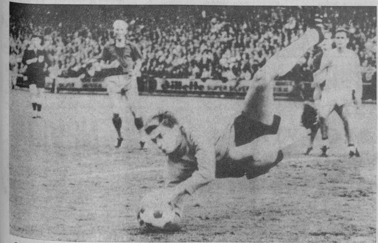
Oslo, 30.—Copa de Europa de Campeones de Copa: Skeid de Oslo-Real Zaragoza. El guardameta del Skeid bloca el balón tras una difícil estirada.—(Foto AP-Europa Press).

Londres, 31.—Según ha revelado el periodista Peter Galdstone Smith en el «Sunday Telegraph» un fraude de proporciones mundiales ha sido descubierto por banqueros de la «City» con repercusiones que se extienden a Sudamérica.—Efe.