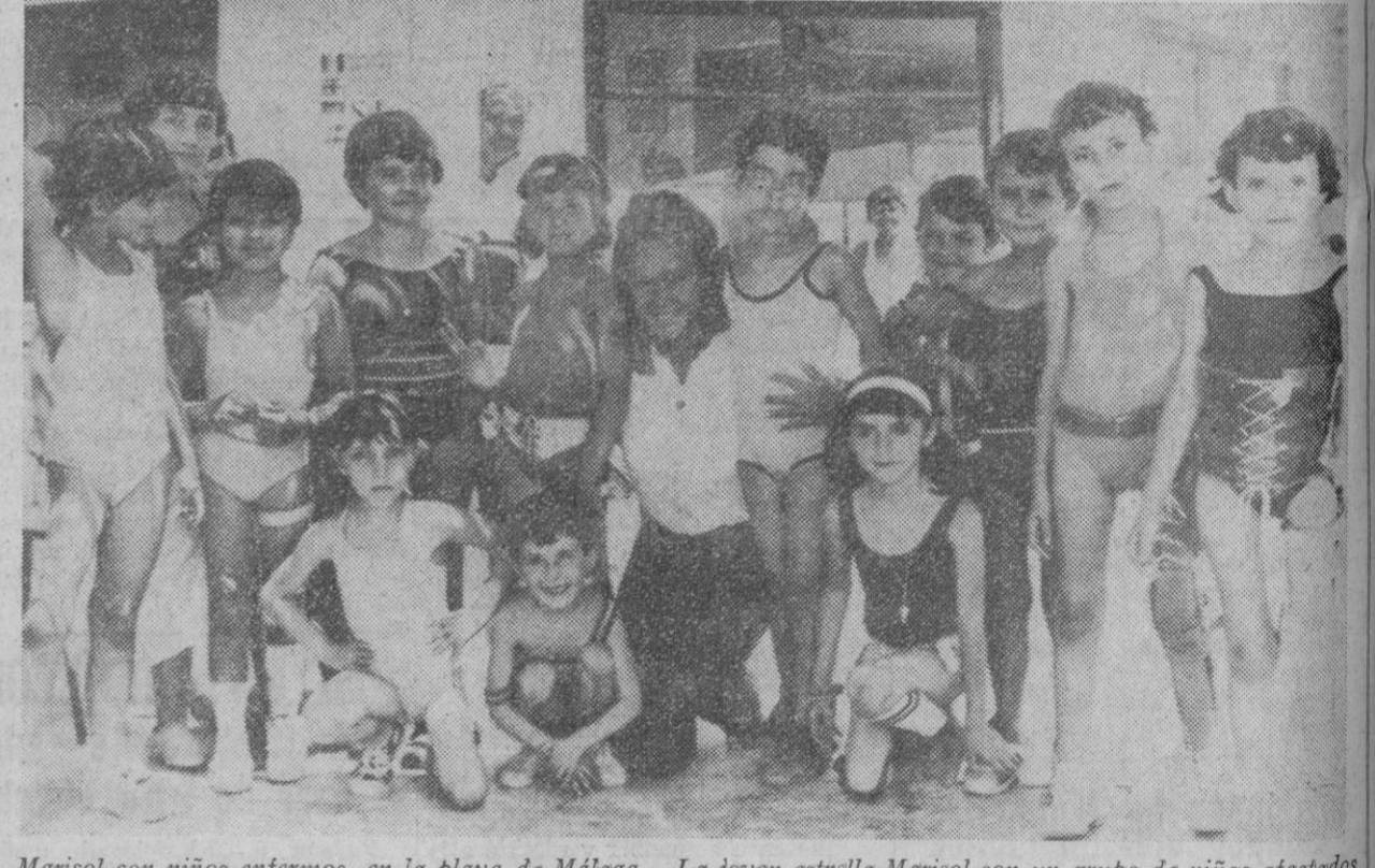
Marisol con niños enfermos, en la playa de Málaga.—La joven estrella Marisol con un grupo de niños afectados por la polio. Pasó con ellos un día en la playa. Jugó y comió con los pequeños enfermos.

Cada uno tiene 129 años Moscú, 5.—Nasr y Geokchik Kaimof, matrimonio de labriegos de la República de Azerbaiján, han celebrado hoy el 75 aniversario de su enlace. Ambos tienen 129 años de edad.—Efe-Upi.