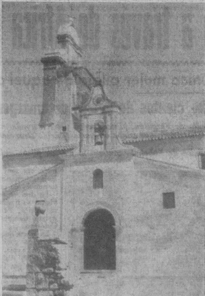
Luminoso aspecto de la fachada del mediodía de la iglesia parroquial de San Benito Abad, des Chañe, después de la restauración a que está siendo sometida

CURIOSIDADES En Segovia nos había llegado una noticia que no pudimos comprobar. Se refería ésta a que con motivo de las obras aludidas habían sido halladas unas imágenes de valor. Nada de