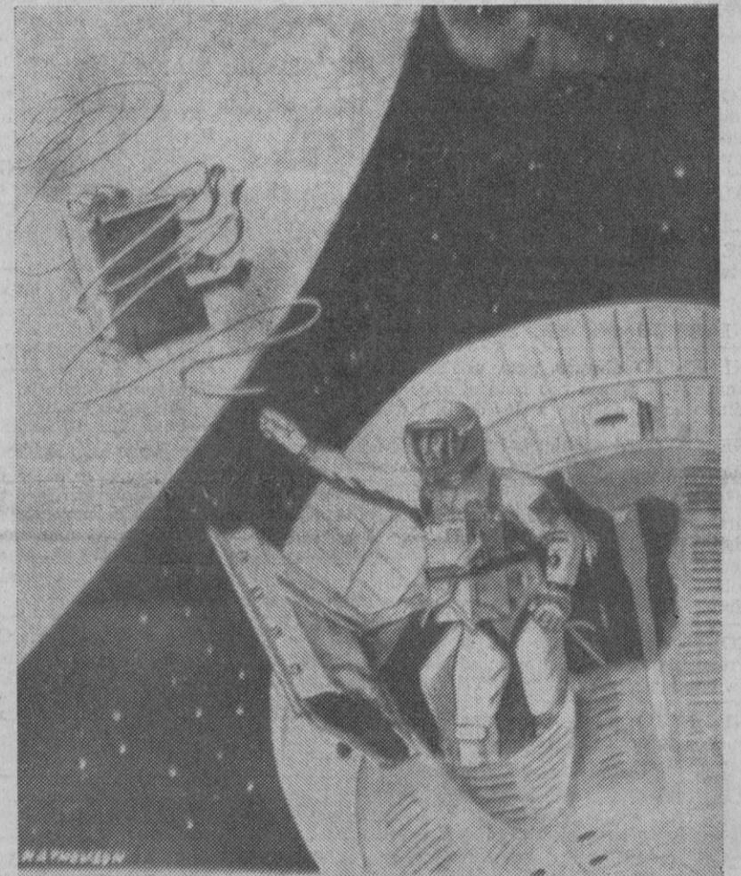
El astronauta norteamericano Eugene Cernan, regresando a la cápsula «Gemini 9», después de su paseo espacial de dos horas y cinco minutos, realizado ayer. Abandona el equipo que le ha servido para desplazarse por el espacio. Este diseño ha sido realizado por un norteamericano.

El regreso del «Gemini 9» a la Tierra se ha producido a la hora prevista, setenta y dos horas y veinte minutos después de su lanzamiento, desde Cabo Kennedy.