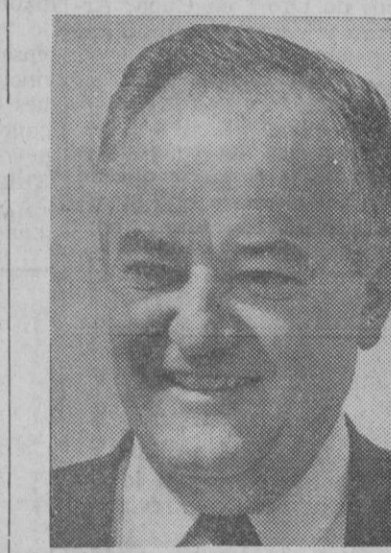
Hubert Humphrey, vicepresidente de los EE. UU.

Humphrey ha proseguido diciendo: «Estamos decididos a instrumentar los objetivos de la declaración (Continúa en la página 6)