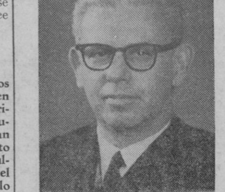
Arthur J. Goldberg

La tercera edición saldrá a la luz mañana.—Cifra.