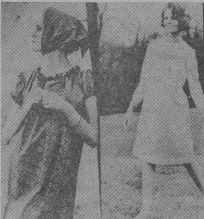
El modelo de la izquierda es del estilo "campesino", estampado en flores menudas sobre fondo oscuro, y con pañuelo de idéntico tejido. El de la derecha, estilo "bebé", es azul pálido, bordado en mdo de abeja, con canesú y mangas.