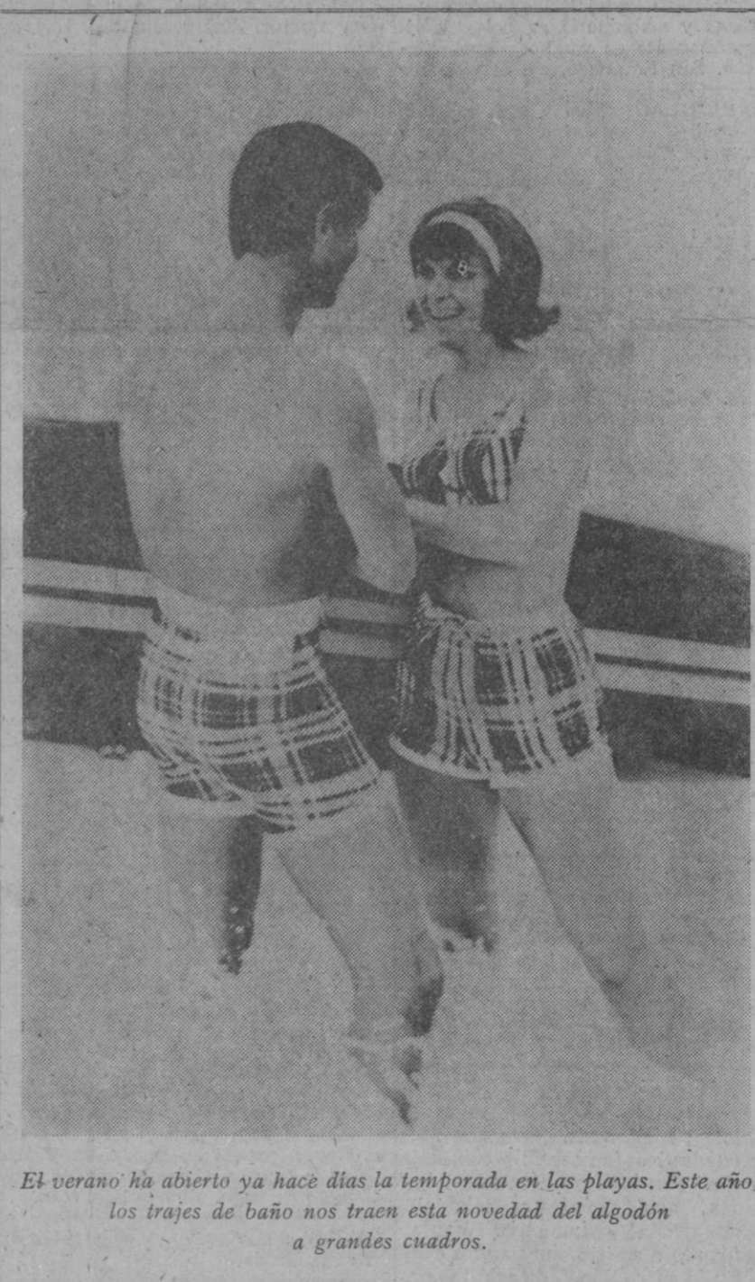
El verano ha abierto ya hace días la temporada en las playas. Este año, los trajes de baño nos traen esta novedad del algodón a grandes cuadros.

Tres escuelas superiores han sido clausuradas por expedición de falsos certificados.—Efe.