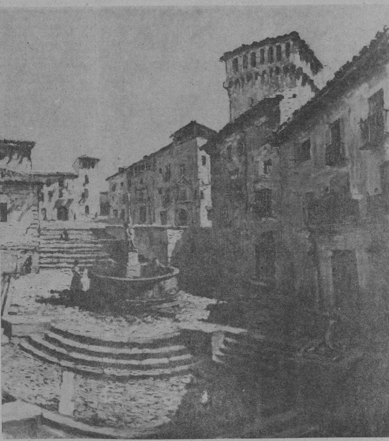
La plaza de San Martín en su estado primitivo.—(Oleo de Jesús Unturbe.)