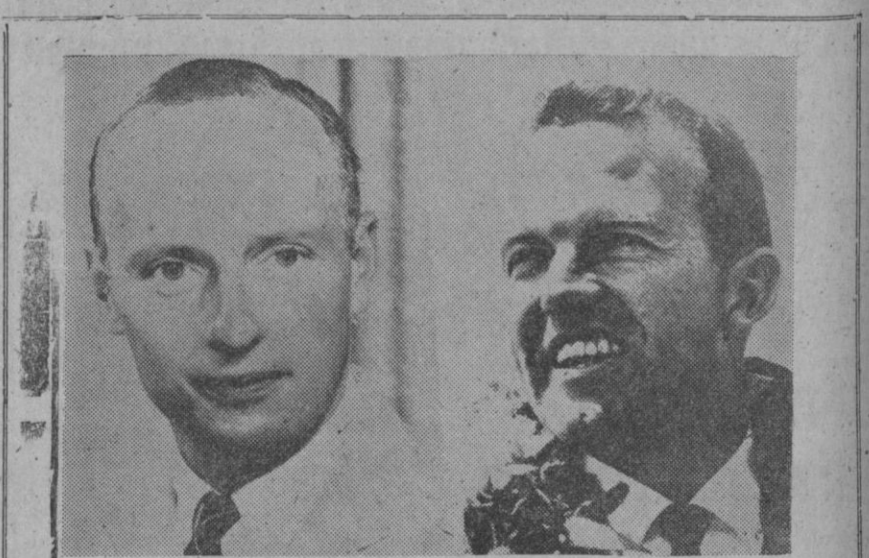
Cabo Kennedy (Florida).—Sobre el próximo 17 de agosto, como es sabido, serán lanzados al espacio, a bordo de la cápsula "Gemini V", los astronautas Conrad y Cooper, que darán vueltas alrededor de nuestra planeta durante ocho días. En la foto, a la izquierda, Charles Conrad. A la derecha, Gordon Cooper, veterano ya en los vuelos espaciales.

Se celebrarían elecciones dentro de seis a nueve meses.