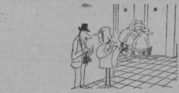
—Bridgette Bardot? Habitación 18.