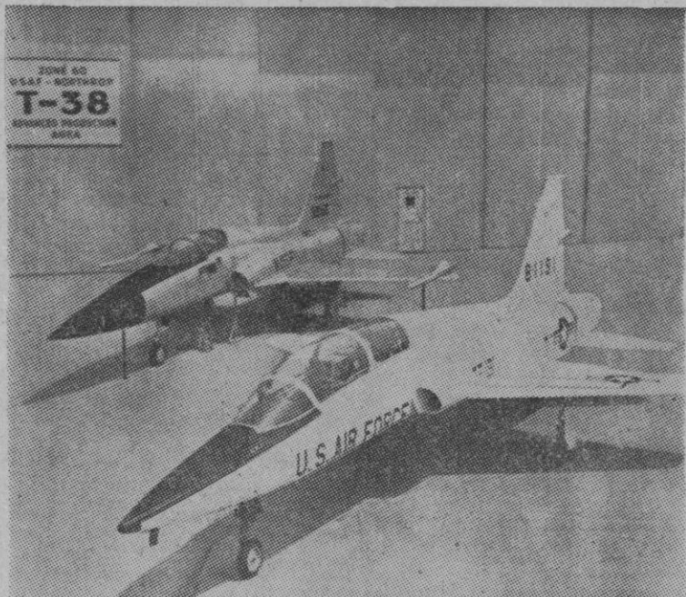
En la foto, las dos versiones, entrenamiento avanzado "Tson" y caza "F-5", del avión supersónico Northop de las que setenta ejemplares van a ser fabricados en España por importe de dos mil ochocientos millones de pesetas, según lo anunciado por el Ministerio español del Aire, para el Ejército del Aire.

Guatemala 24.—El Gobierno de Guatemala ha decretado el estado de sitio «por todo el tiempo que sea necesario». El país, regido por un Gobierno militar, ha venido sufriendo en el interior las actividades de las guerrillas «pro castristas», financiadas y apoyadas desde Cuba. Han quedado suspendidas las garantías constitucionales.