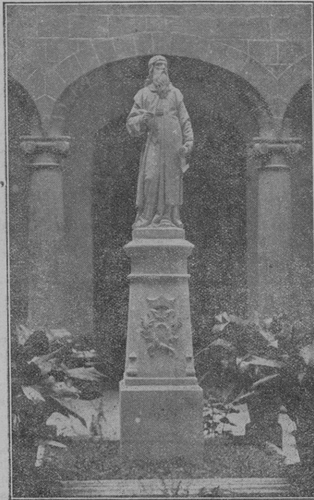
Monumento al Bto. Ramón Lull que ha sido levantado en el patio del Colegio de La Sapiencia y fué bendecido el día de la festividad del glorioso Mártir mallorquín.

Para hoy, a las doce y tres cuartos, han sido convocados a una reunión los concejales nombrados por el pleno para entender en lo referente a una petición elevada al Ayuntamiento, solicitando apoyo para la celebración de un Congreso Internacional de Turismo en Mallorca.