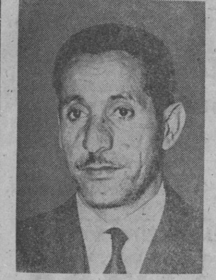
Hammud el Jaefy, nuevo primer ministro del Yemen en cuya zona fronteriza con Adén se están produciendo escaramuzas

La prensa francesa, por otra parte, destaca las declaraciones del señor López Bravo a «Le Figeiro», manifestando que han producido muy buena impresión. Subraya además el progreso de las buenas relaciones entre ambos países, señalando que España es el sexto cliente de Francia.