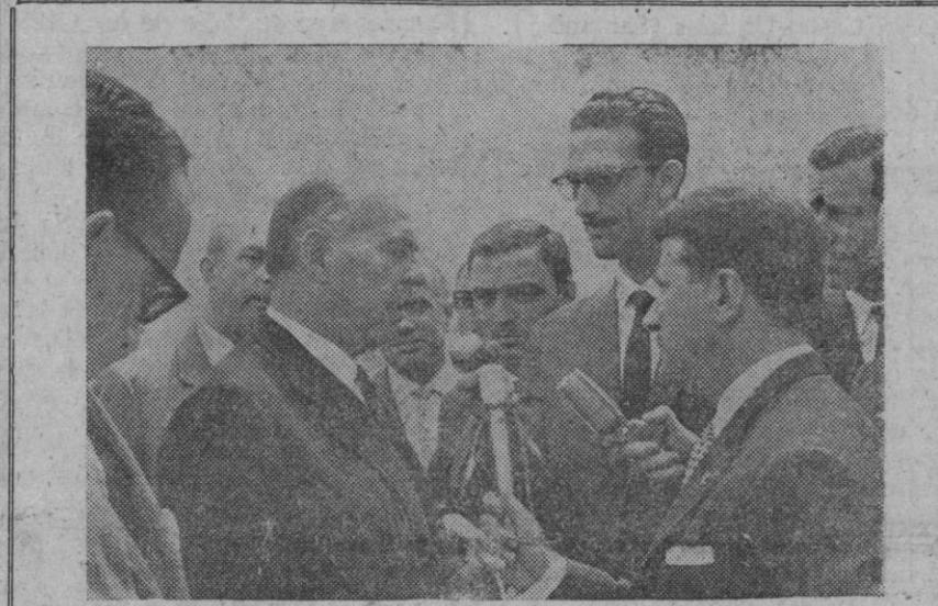
Madrid.—Procedente de Londres, ha regresado el ministro secretario general del Movimiento y delegado nacional de Sindicatos, don José Solís Ruiz, quien se ha entrevistado en la capital británica con altos miembros del Gobierno. En la foto, poco después de su llegada a Madrid, donde fue recibido por el vicesecretario, señor Herrero Tejedor, y otras personalidades del departamento.

el arzobispo de Valencia y por el marqués de Lozoya.