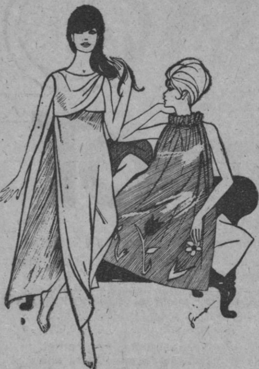
Izquierda: Toga drapada con abertura a uno de los costados en crepé blanco.

Las mañanitas son de estilo capa y a menudo se abrochan con automáticos en los hombros, a camisones a juego y los fabricantes de prendas de corsetería me han informado de que las fajas pantalón van a ser más populares este año que nunca.