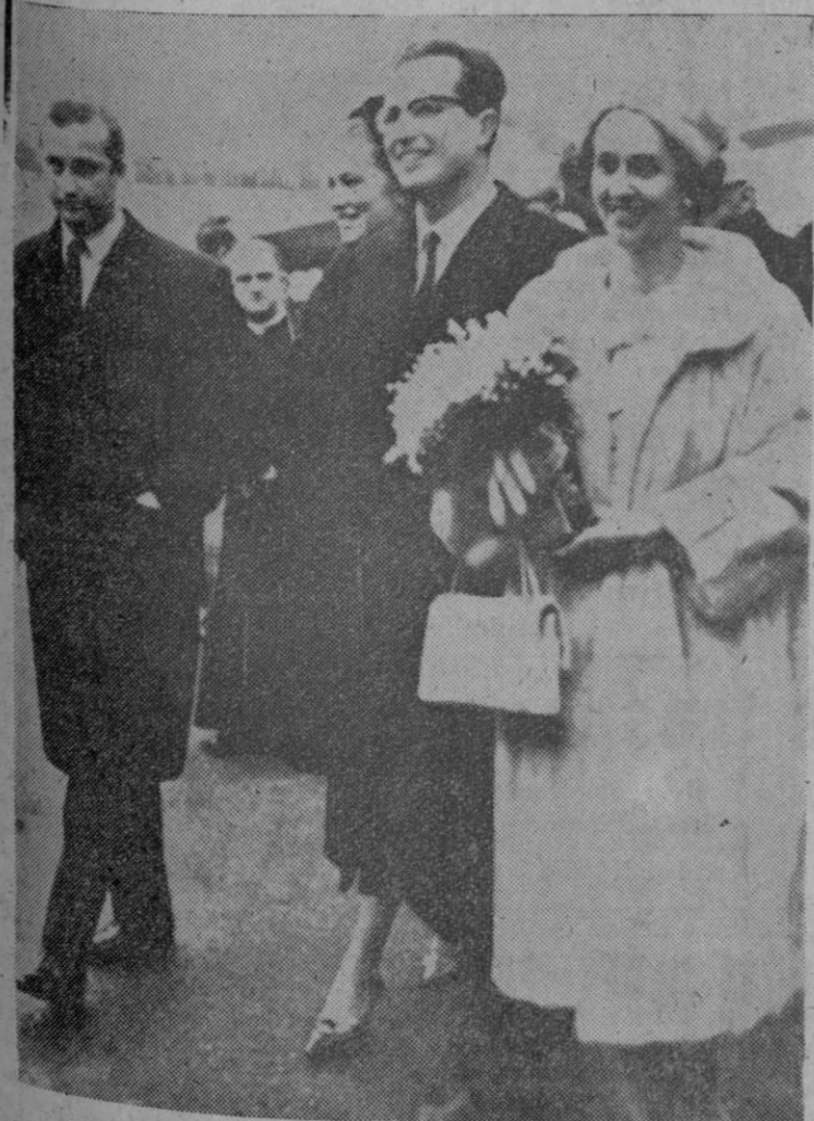
Los Reyes de Bélgica, Fabiola y Balduino, han regresado a Bruselas después de su largo viaje por diversos países asiáticos y los Santos Lugares. En el aeropuerto fueron recibidos por el príncipe Alberto y su esposa, la princesa Paola. En la telefoto, los Reyes, acompañados de los príncipes, a su llegada al aeropuerto de la capital belga.

Méjico, 21.—La Reina Juliana y el príncipe Bernardo de los Países Bajos realizarán una visita oficial a Méjico entre los días 8 y 17 de abril próximo, ha anunciado un portavoz del Ministerio mejicano de Asuntos Exteriores. Efe.