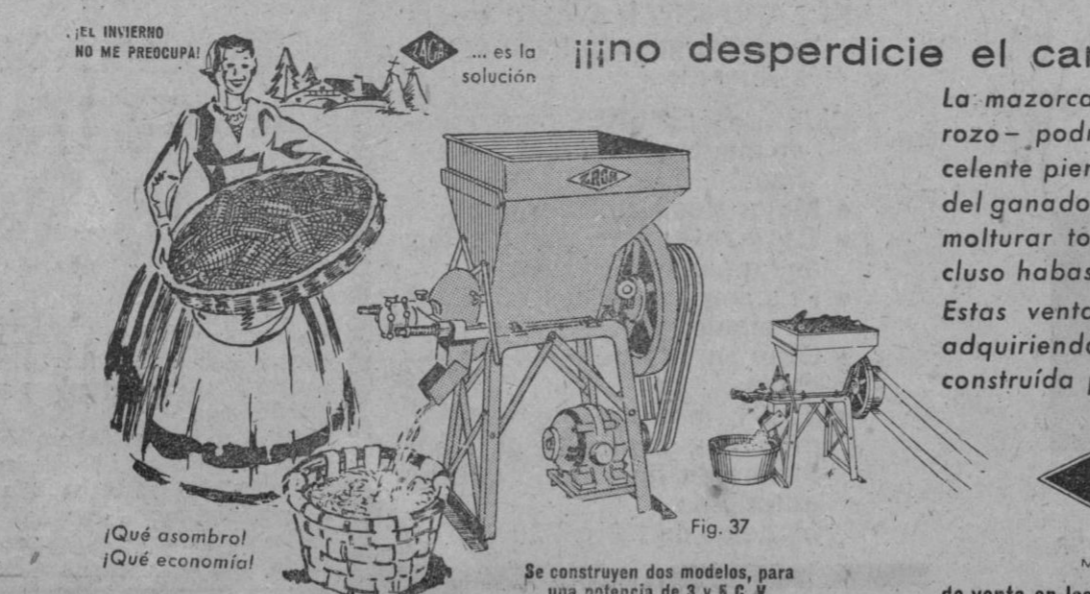
Fig. 37. Se construyen dos modelos, para una potencia de 3 y 5 C. V.

AVENTURALANDIA.—A la izquierda de la Calle Mayor USA se encuentra Aventuralandia. Es una vasta extensión de ríos que fluyen por bosques y junglas tropicales. Unos barcos llevan al visitante a lo largo de estas vías de agua, y así se embarca en un safari simulado por los ríos Mekong, Nilo, Congo y Amazonas. En cada recodo surge un peligro fingido: gigantescos gorilas se golpean el pecho; elefantes trompetean furiosamente. En el agua los cocodrilos e hipopótamos se agitan violentamente. Por supuesto, no son de verdad, son criaturas de la imaginación de Walt Disney. Animales animados que se mueven mecánicamente. Su realismo es sobrecogedor. Las tripulaciones de los barcos fluviales que surcan las aguas de Aventuralandia contribuyen a dar una sensación de verismo a la escena. Por ejemplo, cuando un barco se aproxima a los rápidos del río, el capitán grita: «Nos acercamos a los rápidos, y es posible que no nos salvemos.» Hay también reproducciones de templos camboyanos y muchas especies de plantas y vegetación tropicales.