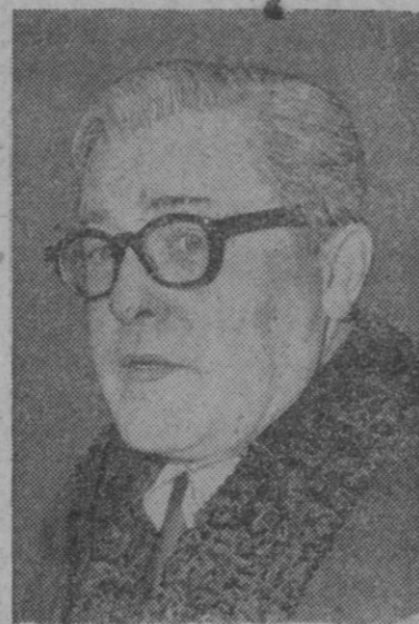
Melvin Belli, el abogado norteamericano de los procesos sensacionales, que se ha encargado de la defensa de Jack "Ruby", asesino de Lee H. Oswald, presunto asesino del presidente Kennedy