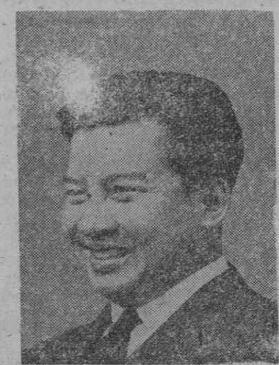
El príncipe Norodom Sihanouk, jefe de estado de Camboya, quien ha renunciado a la ayuda militar y económica de los EE. UU.

En Turín ha tenido lugar esta tarde, a las tres y media (hora española) el partido de fútbol entre la Juventus y el Atlético de Madrid, correspondiente al primer encuentro de la eliminatoria para la Copa de Ciudades en Ferias. La primera parte del encuentro finalizó con el resultado de 1-0 favorable al equipo italiano. El gol fue marcado a los 31 minutos de juego. Finalizó el partido con el mismo resultado.