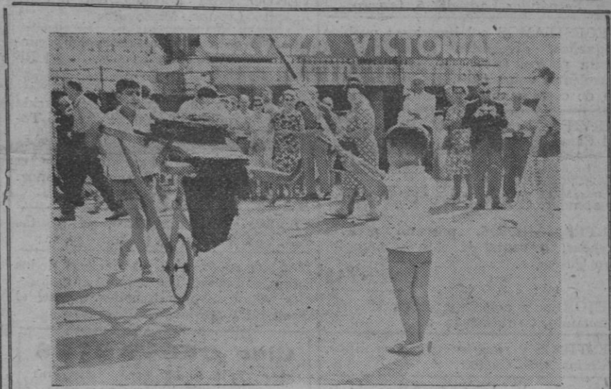
Para aprender el arte de Cuchares en versión alemana, sueca, danesa, etc., en el caso taurino de la «Malagueña» (Málaga), se han organizado unos cursos de la taurina para turistas. Las clases se celebran todos los martes y se ven muy concurridas.

do completamente destruida. No obstante, a la hora actual, es imposible precisar el balance trágico de vidas humanas y los daños causados por esta desgracia de proporciones nacionales.—Efe.