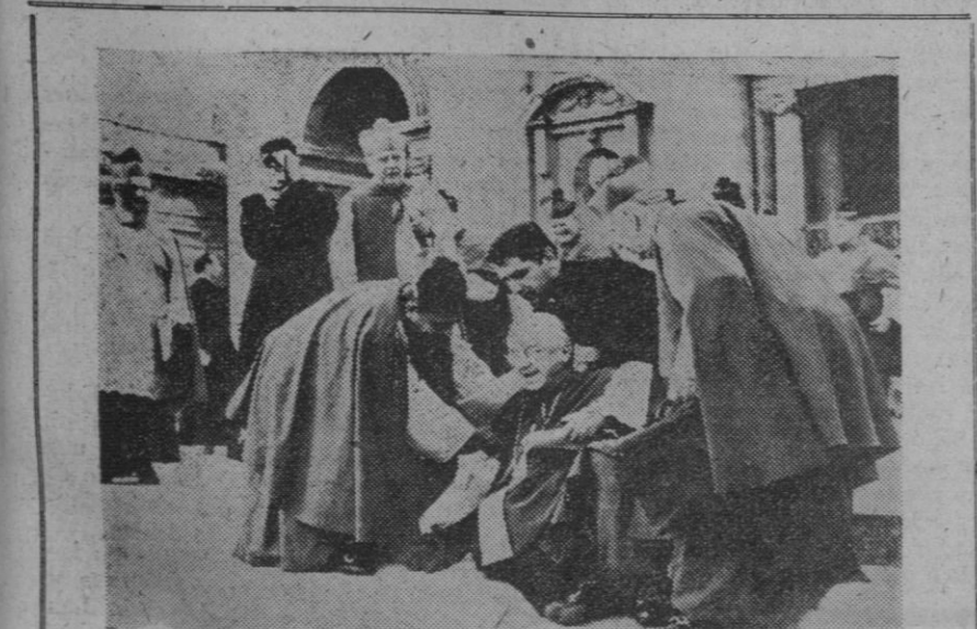
El obispo de Panamá, monseñor Retman, es atendido solícitamente por otros dos obispos, y uno de sus familiares, al caerse, a consecuencia de un resbalón, en la escalinata de la basílica de San Pedro, a la salida de una de las congregaciones de la segunda sesión del Concilio. Ajeno al accidente, un sacerdote (a la izquierda), filma el espectáculo de la plaza de San Pedro.

El número de manifestantes detenidos se eleva a unos cuatrocientos. Veinte vehículos fueron volcados, y un camión de la Policía fue incendiado.—Efe.