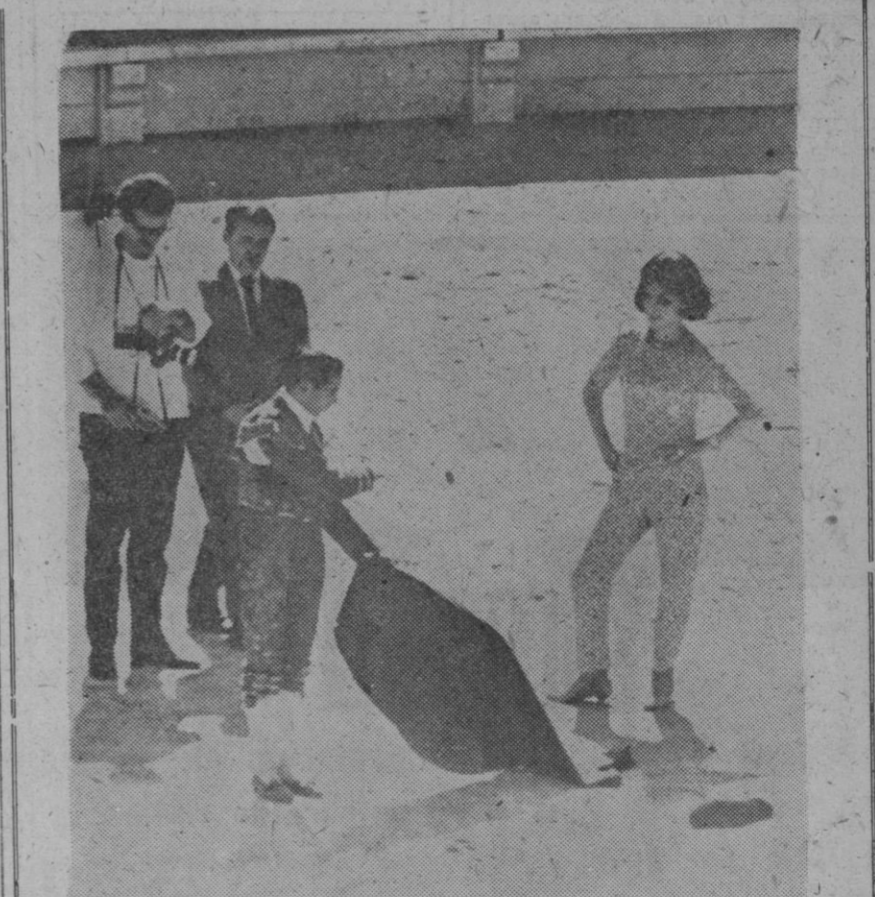
Gina Lollobrigida se encuentra en Palma de Mallorca para rodar una película. Sin embargo ha concedido una exclusiva a la revista "Oggi". Con tal motivo tres reporteros gráficos de la misma han sometido a la "Lollo" a un intenso trabajo para conseguir las exclusivas. Que no fueron tanto. Los citados reporteros aguardaron por unas horas la plaza de toros mallorquina para retratar a Gina en plena faena. La famosa italiana consiguió diversos pases, muleta en mano, saltando la barreira, clavando banderillas, y después la vaquilla fue retratada sin la estrella delante. Es muy posible que en la revista aparezca Gina Lollobrigida toreando en la isla balear. El truco puede tener efecto.