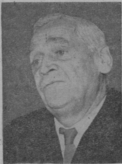
A. Blagonarrov, famoso científico ruso en cuestiones espaciales, quien considera deseable la cooperación entre Rusia y Estados Unidos para el lanzamiento de cápsulas tripuladas a la Luna

pítulo que tendrá que ser redactado teniendo en cuenta las enmiendas presentadas.