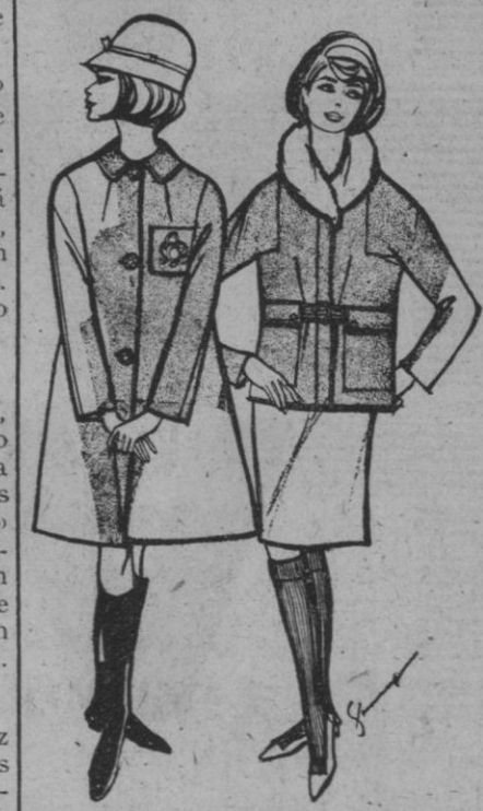
Izquierda: Una nota brillante en medio de la lluvia: una insignia dorada en un bolsillo de una gabardina de nylon. Unos botones dorados completan el conjunto de esta gabardina con forros de espuma. Derecha: Chaqueta corta de sport en nylon forrada de Tricot guateado. Observe su línea sin botones y cómo el cinturón desaparece a la altura de los bolsillos. El toque final, un cuello de piel artificial.