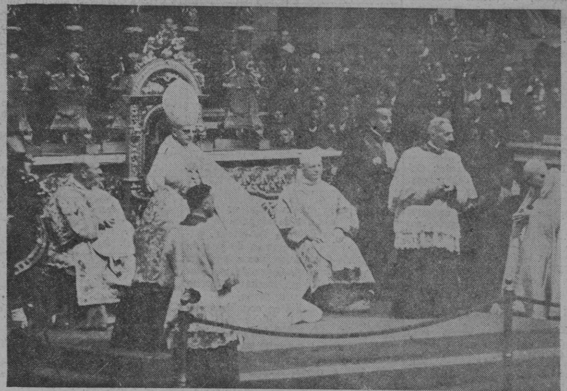
Su Santidad el Papa, durante la solemne sesión de inauguración de la segunda fase del Concilio Vaticano II, ceremonia celebrada en la basílica de San Pedro.

También se recoge la necesidad de financiación para cubrir exclusivamente los gastos de recogida, molturación y cultivo del olivar hasta el final de mayo, que ascienden a 8.796 millones de pesetas. Cifra.