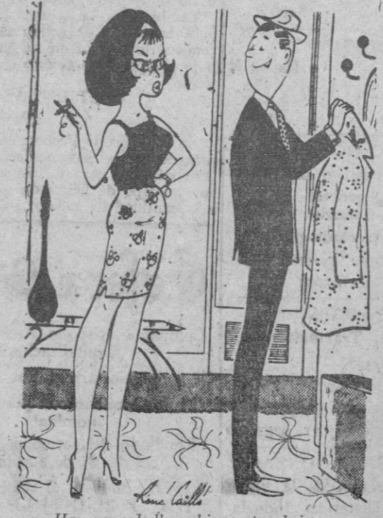
—Hay un cabello rubio en tu abrigo. —Es posible. El año pasado tu eras rubia, ¿no?