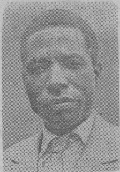
Massemba Debat, nuevo presidente de la República del Congo (antiguo Congo francés)

Srinagar. (Cachemira), 3.—Fuerzas de la policía, ejército y grupos de voluntarios civiles, proceden a la búsqueda, entre los escombros de 58 localidades del valle de Cachemira, de víctimas de los temblores de tierra, registrados en la mañana del lunes. Se teme que el número de muertos se eleve a más de un centenar. Los heridos se elevan ya a trescientos. Según las últimas noticias, han sido encontrados ya los cadáveres de setenta y tres personas.—Efe.