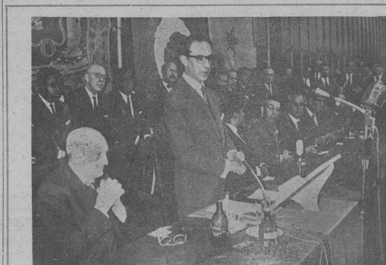
El ministro de Comercio, don Alberto Ullastres, durante la inauguración de la Feria de Muestras de Bilbao, pronunciando un importante discurso. Junto a él, el presidente de las Cortes españolas, señor Bilbao. Tras él, los ministros invitados, de Pakistán, Senegal y Camerún.

reiterándose las muestras de adhesión popular hacia Sus Excelencias desde que partieron de la calle Mayor hasta su llegada nuevamente al Palacio de Ayete.