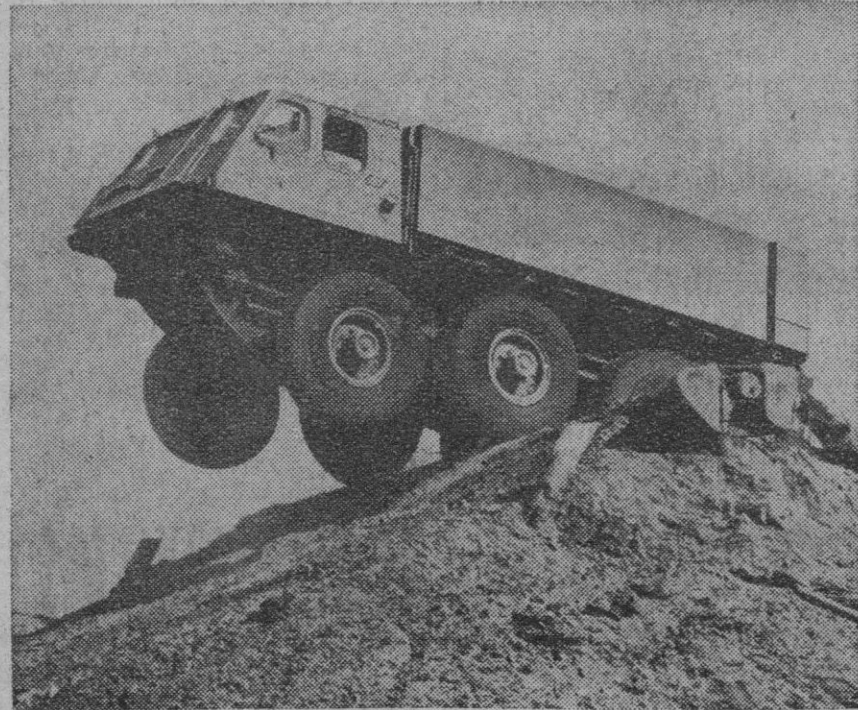
En 1961, una de las principales firmas manufactureras británicas introdujo un camión onfibio de cinco toneladas, para todos los terrenos, y de utilidad militar. Esa firma acaba de poner a punto la versión civil de dicho vehículo. Capaz de circular por cuantos terrenos lo haga normalmente un vehículo sobre orugas, puede salvar muros de hasta cuarenta y seis centímetros y fosos de un metro cincuenta centímetros con relativa facilidad, para después lanzarse al agua, sin preparativos previos, y continuar su camino. Puede transportar cinco toneladas de carga y remolcar otras diez.

Trabajador: Utiliza para tus hijos esta nueva prestación que defiende la salud