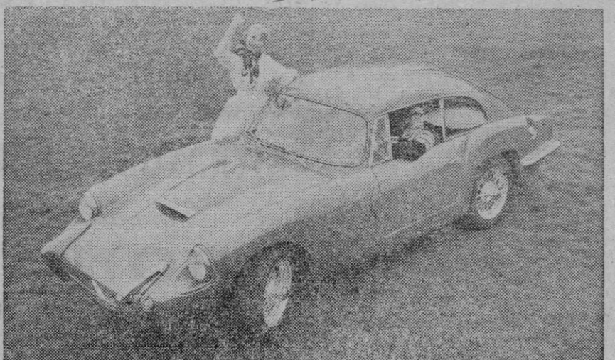
Nueva versión del coche deportivo británico «Sabre». Propulsado por un motor de cuatro cilindros, de 1,7 litros de cubicación, va provisto de dos-cuatro asientos. Es un gran turismo, con cupé fijo, que sustituye el cupé desmontable de dos asientos. La carrocería es de fibra de vidrio.

Por la mañana continuó la precipitación, aunque más débilmente. La temperatura, debido a que a la