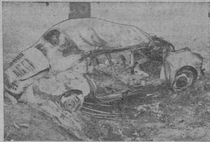
Uno de los trágicos accidentes ocurridos en nuestra provincia en 1962: El "4-4" chocó contra un árbol y se incendió. Hubo tres segovianos heridos, dos de los cuales murieron después