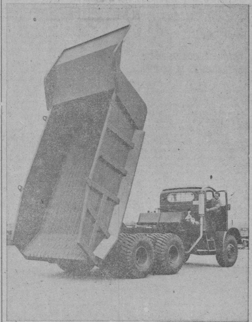
Acaba de lanzarse al mercado este nuevo vehículo inglés, de gran potencia. Se trata de un camión-volquete cuya capacidad de carga es de 13,75 metros cúbicos. Ha sido proyectado como un vehículo de rápida descarga, muy conveniente para el trabajo en canteras, talleres metalúrgicos y minas, y se adapta perfectamente a toda clase de terrenos. El mecanismo vasculante ha sido diseñado para proporcionar una inclinación de setenta grados en doce segundos. El regreso a la posición normal se efectúa en diez segundos, con lo que la operación completa de vaciado se efectúa en 22 segundos

Singapur, 28.—Un portavoz del cuartel general británico ha declarado hoy que los informes de que paracaidistas ingleses habían sido lanzados sobre Borneo, son «incorrectos». Los referidos informes señalaban que tropas británicas habían sido lanzadas sobre las selvas de Borneo tras haberse sabido, por medio de los servicios de inteligencia, que «voluntarios» indonesios se estaban infiltrando en los territorios británicos de Brunei y Sarawak.—Efe.