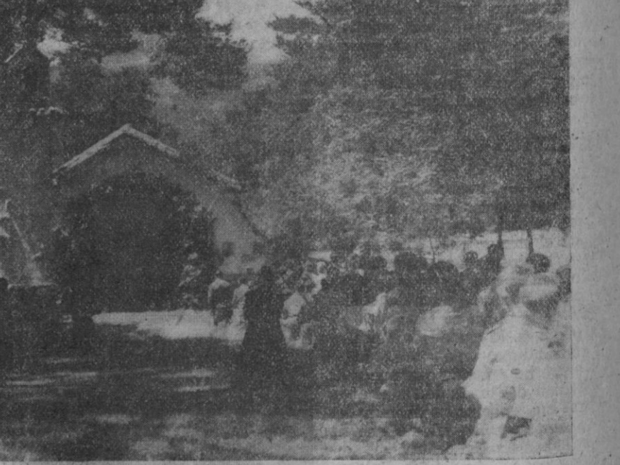
Misa en el campamento de San Rafael. La formación que se da a los acampados incluye un profundo espíritu religioso y la Cruz preside todos sus quehaceres.

MOTOCARRO ISO modelo TITAN, 1962 200 c/c 4 velocidades y marcha atrás ACCESORIOS LA UNION