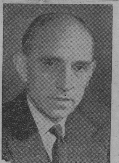
Sir Humphrey Trevelyan, antiguo embajador de Inglaterra en Bagdad que ahora ha sido nombrado embajador en Moscú

Zaragoza, 22.—Ha sido detenido en Santa Cruz de Tenerife, en virtud de órdenes cursadas por la Jefatura Superior de Policía de esta capital, al desembarcar del buque correo de Barcelona, el apoderado de la Sucursal en Zaragoza de una importante entidad bancaria, presunto autor de apropiación indebida de una cantidad que se calcula superior a los dos millones de pesetas.