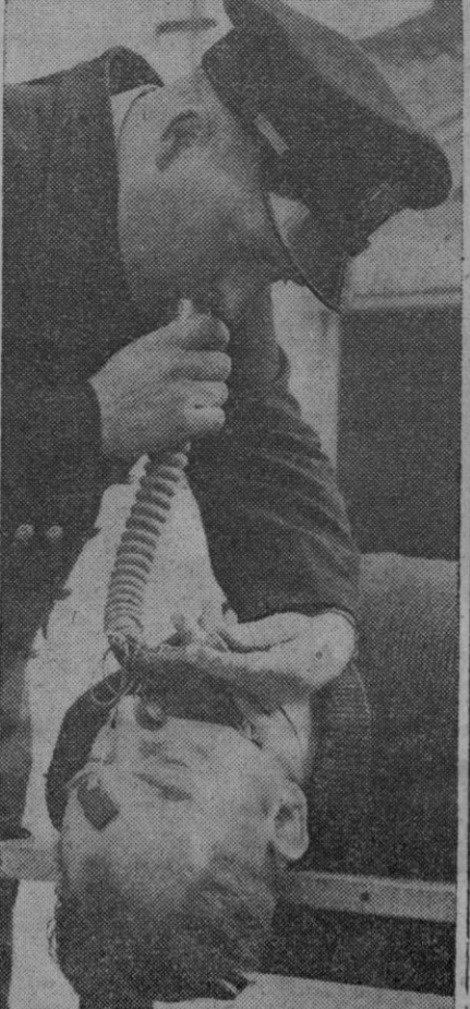
El nuevo método de respiración artificial insuflando el aire a la boca del paciente ha dado lugar a este invento, un tubo fácilmente adaptable a la boca del enfermo y a través del cual se insufla el aire

Londres, 22.—Se ha anunciado el descubrimiento de una nueva droga que combate eficazmente las enfermedades mortales del corazón. La «Atromida», nombre de la droga, se ha probado con éxito en todo el mundo con animales. Ahora se está probando en personas en los hospitales de Estados Unidos, Italia, Suiza, Bélgica, Holanda, Escandinavia, África del Sur, Australia, Nueva Zelanda, Canadá y Gran Bretaña. Se esperan los resultados con ansiedad.—Efe.