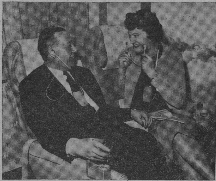
Para entretenimiento de los pasajeros, una línea aérea ha equipado a todos sus aviones con diminutos y ligeros receptores de radio que captan los dos programas emitidos desde el interior del avión. A cada pasajero se le da uno de esos aparatos, y, como puede verse, quienes deseen escuchar los programas lo hacen mediante auriculares personales. Por no tener cables ni necesidad de conectarlos en la pared del avión, los pasajeros pueden moverse libremente en éste sin que ello afecte a la recepción.

Ciento sesenta mesas petitorias, atendidas por asociaciones de apostolado integradas en Cáritas o que colaboran con ella y otras entidades, fueron instaladas en diversos lugares de nuestra capital. Al servicio de cada mesa estuvieron 15 parejas de muchachas para la postulación callejera. Actuaron también equipos volantes en