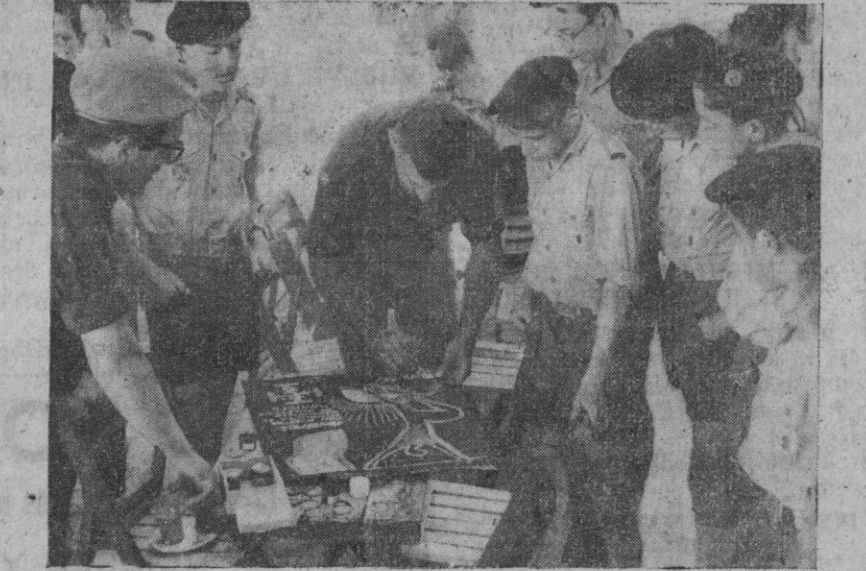
Clase de dibujo al aire libre en el campamento del Frente de Juventudes, en San Rafael. Luego los acampados expresarán sus aficiones y aptitudes artísticas en los periódicos murales y volantes