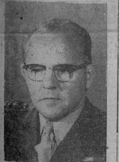
David M. Shoup, general en jefe de los servicios de la Marina norteamericana en Tailandia

Barcelona, 6.—Próximamente serán embarcadas en este puerto, en una motonave escandinava, varias corridas de toros, de diversa ganadería, que serán lidiadas por toreros españoles e hispanoamericanos en el Japón, Hong-Kong, Corea del Sur, Formosa y Filipinas.—Cifra.