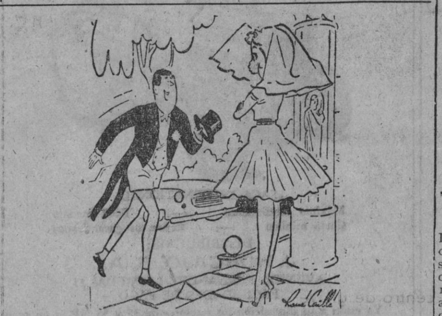
—He tenido que volverme... había olvidado las alianzas.