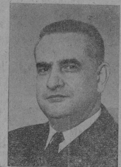
Christian Fouchet, hasta hace poco embajador de Francia en Dinamarca, que ha sido nombrado ahora alto comisario en Argelia hasta tanto que se celebre el referéndum

Las huertas de las márgenes del Miño, en algunos puntos, han sido ya inundadas por las aguas, malográndose las cosechas tempranas, especialmente las de patatas y maíz.—Cifra.