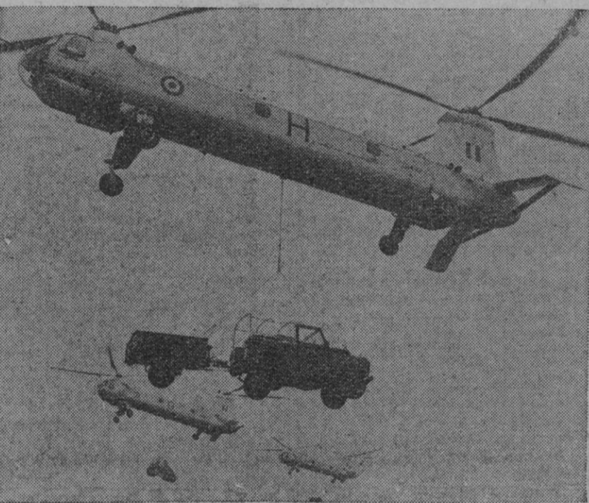
Una escuadrilla de helicópteros "Belvedere", de rotors gemelos, hizo recientemente su primera demostración pública en una base de la R. A. F. En el gráfico, los "Belvederes" demuestran sus posibilidades como transportadores pesados.

Se teme que un anciano invidente haya perecido en el incendio. Los daños se estiman en unas 170.000 libras esterlinas (unos 29 millones de pesetas).—Efe.