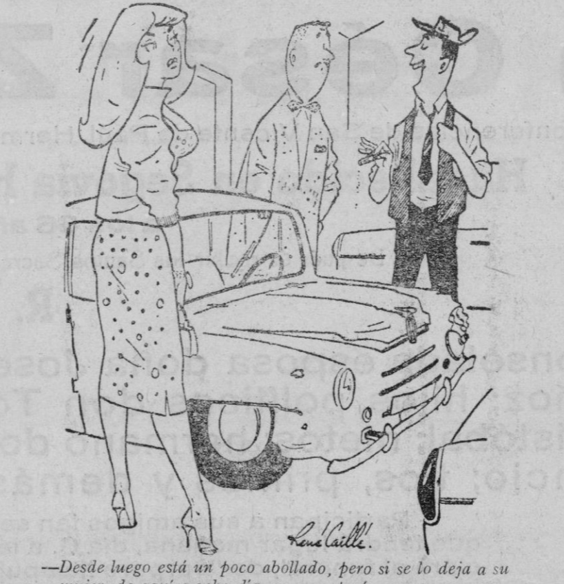
—Desde luego está un poco abollado, pero si se lo deja a su mujer, de aquí a ocho días no se notará...