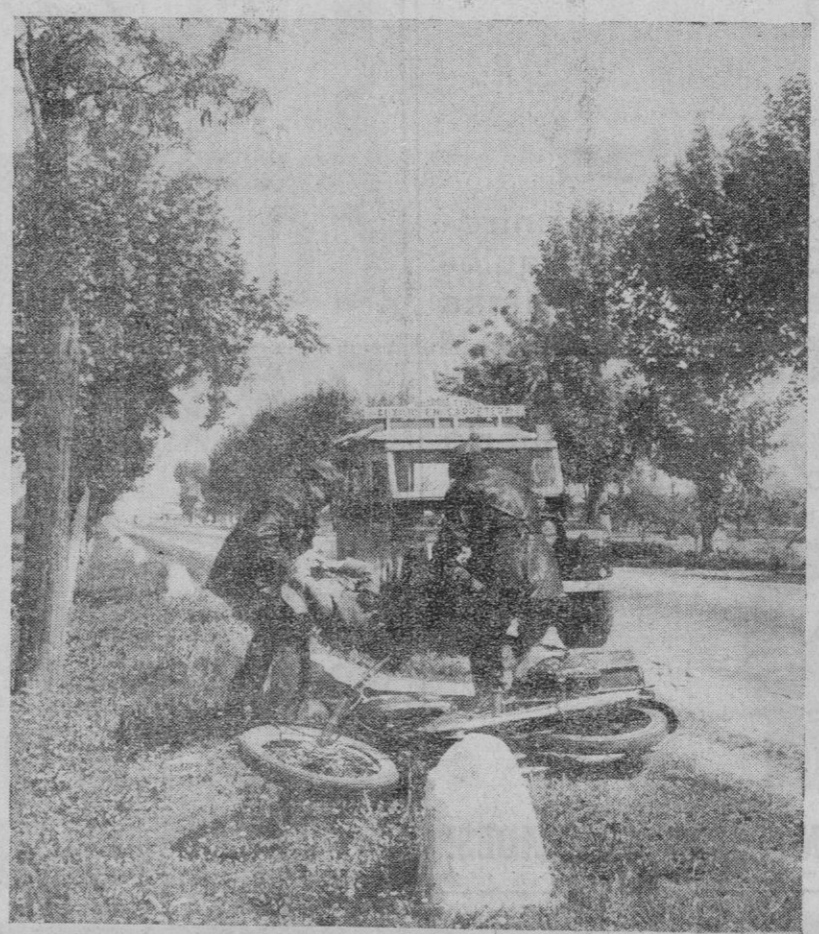
NOTICIA COTIDIANA.—Accidente en la carretera. El coche de Auxilio de la Guardia Civil de Tráfico ha llegado a tiempo. Sus hombres se disponen a trasladar con urgencia al conductor herido al centro sanitario más próximo.