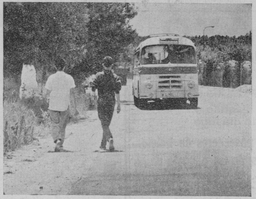
OJO AL AUTOBUS QUE LLEGA.—Estos peatones se aprendieron la lección. Saben que por la carretera hay que circular por la izquierda. ¡Buen viaje, amigos!

—Con mucho gusto. Siempre ha sido principal interés de todos los organismos provinciales intentar mejorar la red de caminos, todo ello dentro de las disponibilidades económicas.