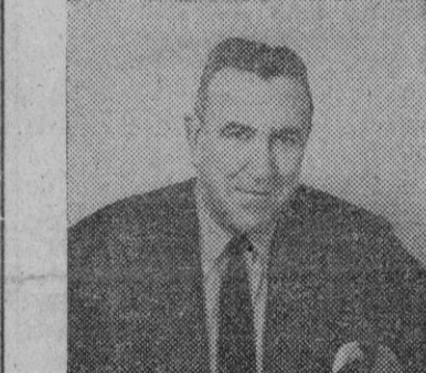
Chester Bowles, subsecretario norteamericano de Estado

Vientian, 5.—El Gobierno laosiano ha declarado que está dispuesto a rendir las armas e iniciar conversaciones con los rebeldes procomunistas del